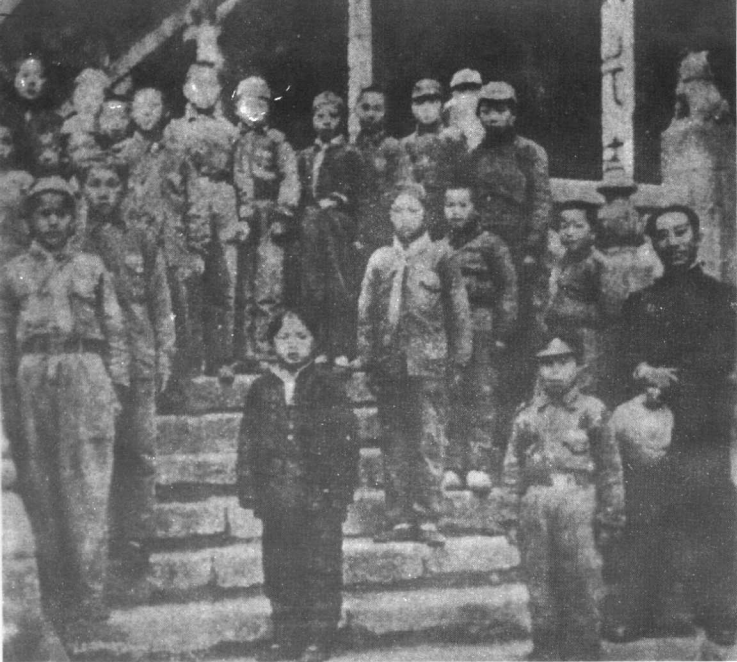
戴笠同收容所儿童合影