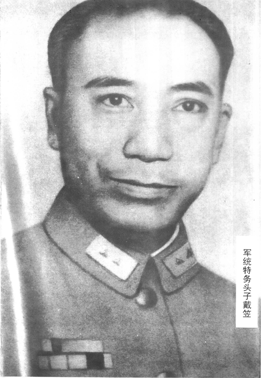
军统特务头子戴笠