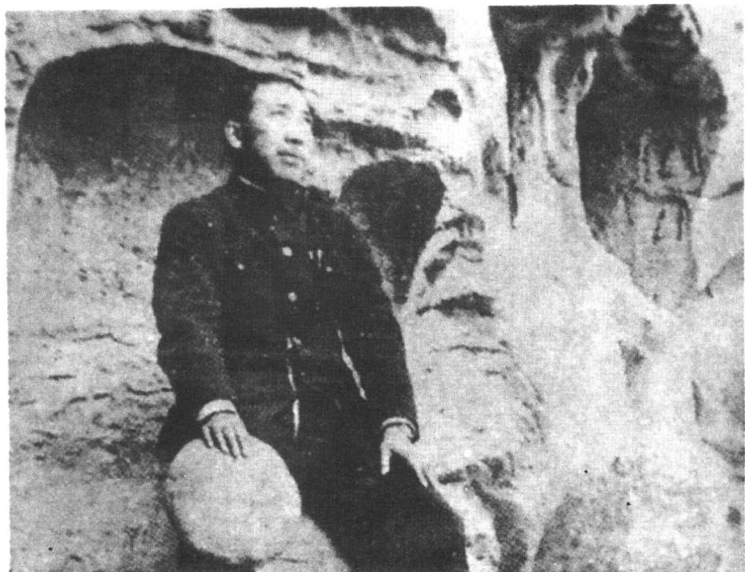
戴笠在佛洞前留念