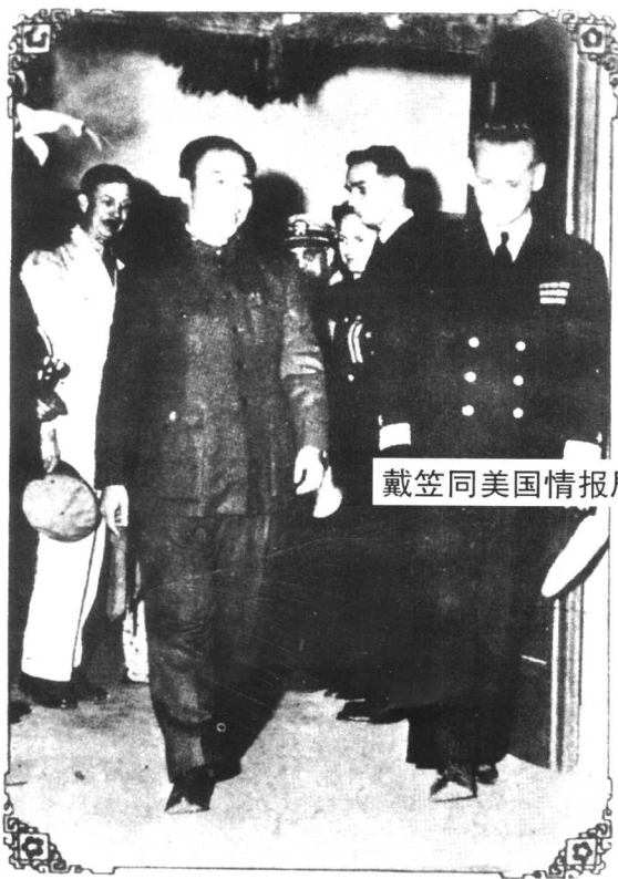
戴笠同美国情报局局长梅乐斯在中美班合影