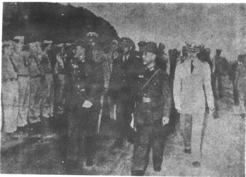
戴笠随同蒋介石检阅中美合作所全体学员