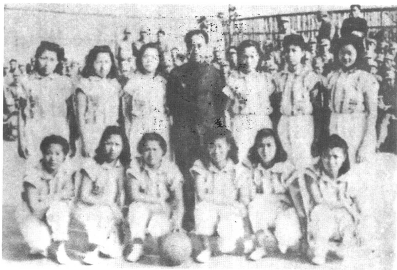
戴笠同军统特务学校篮球队合影