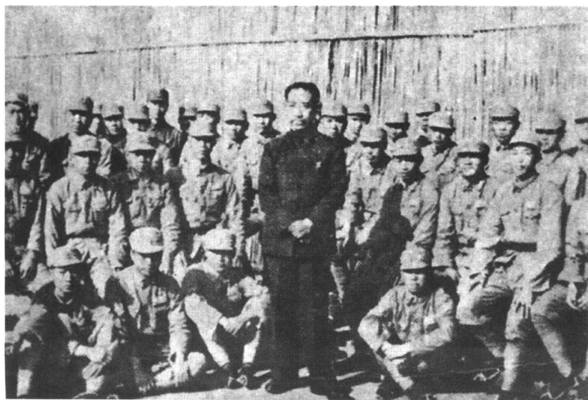
戴笠同特务训练班四期学生合影