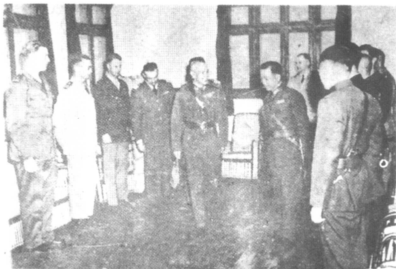
戴笠随同蒋介石会见中美班人员