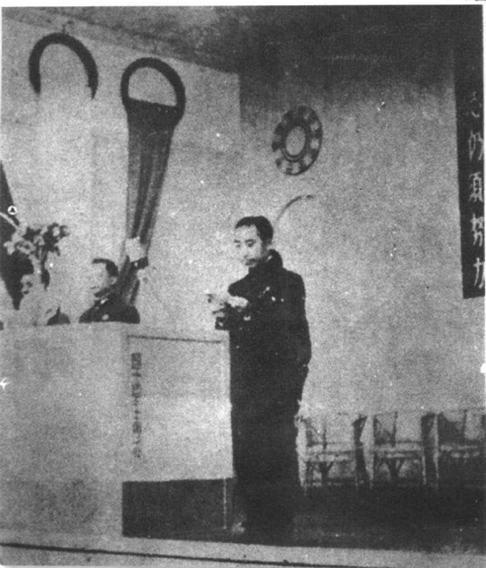
戴笠主持军统特务局十周年纪念大会