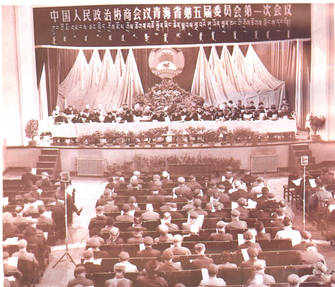
青海省政协五届一次会议