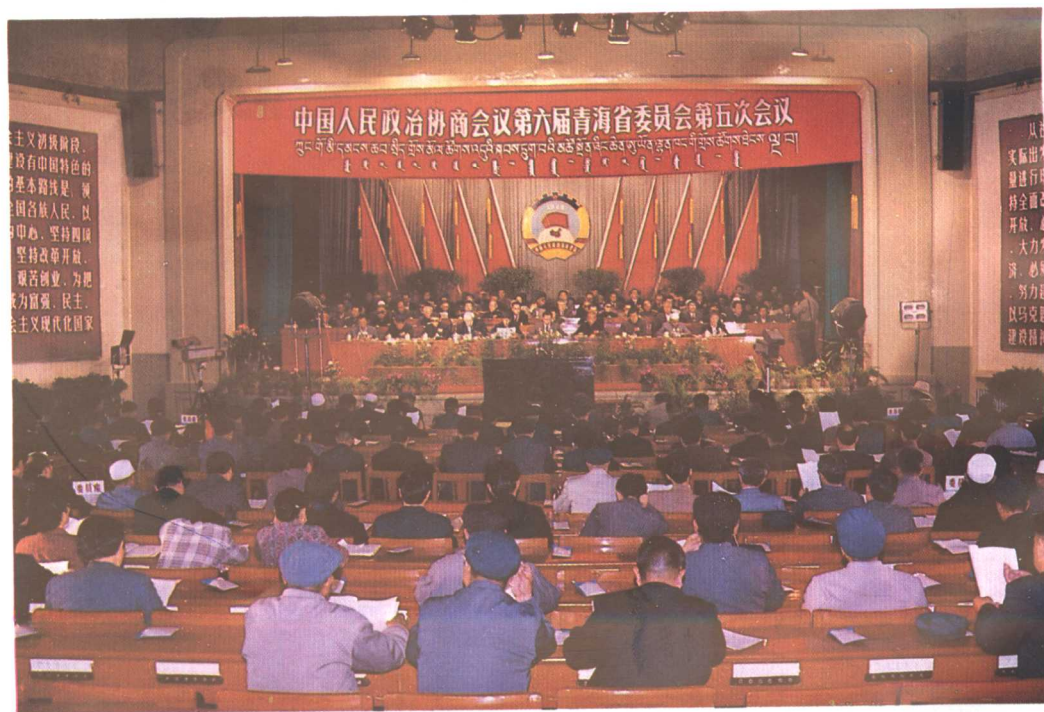
青海省政协六届五次会议