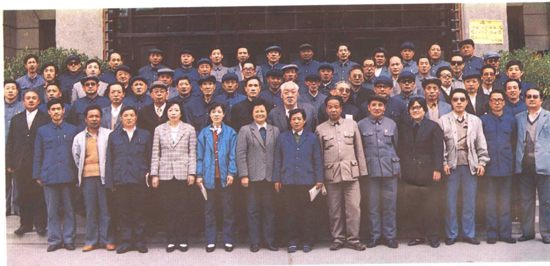
青海省各州、县政协主席座谈会议合影留念