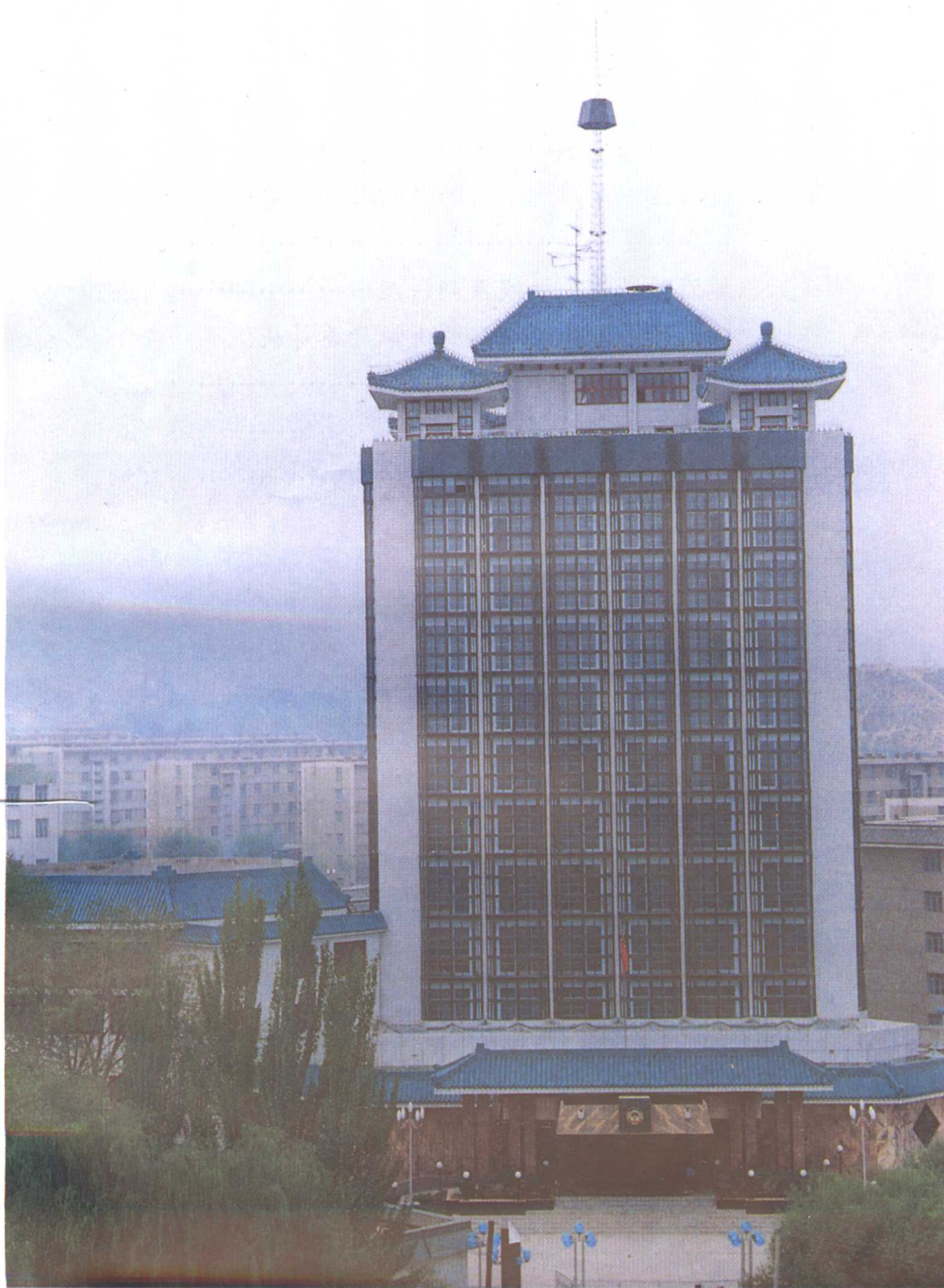
青海省政协办公大楼