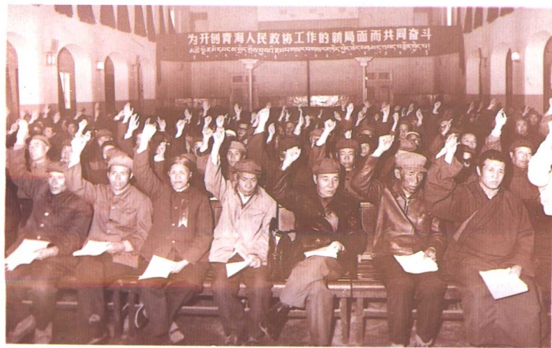
会议一致通过 政治决议