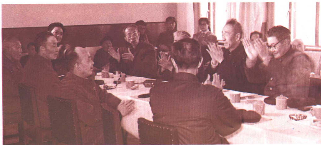
第四届青海省政协委员学习讨论中共十一届三中全会公报