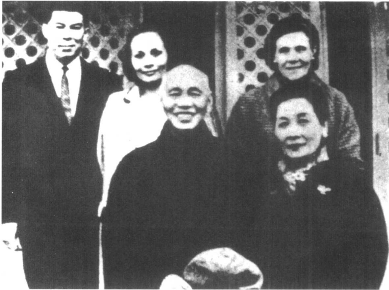
蒋介石、宋美龄与长媳方良及孙女、孙婿。