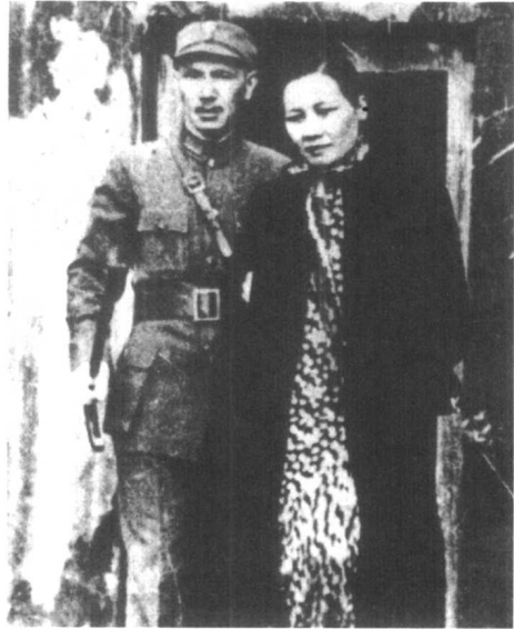
1939年3月，日军向重庆实行大轰炸后，蒋介石与宋美龄步出防空洞。