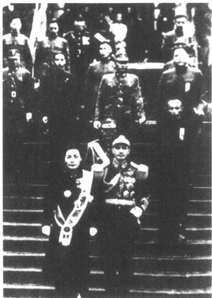
1943年蒋介石就任国民政府主席后，与宋美龄步出礼堂。