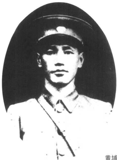
1924年，蒋介石任 黄埔军官学校校长。