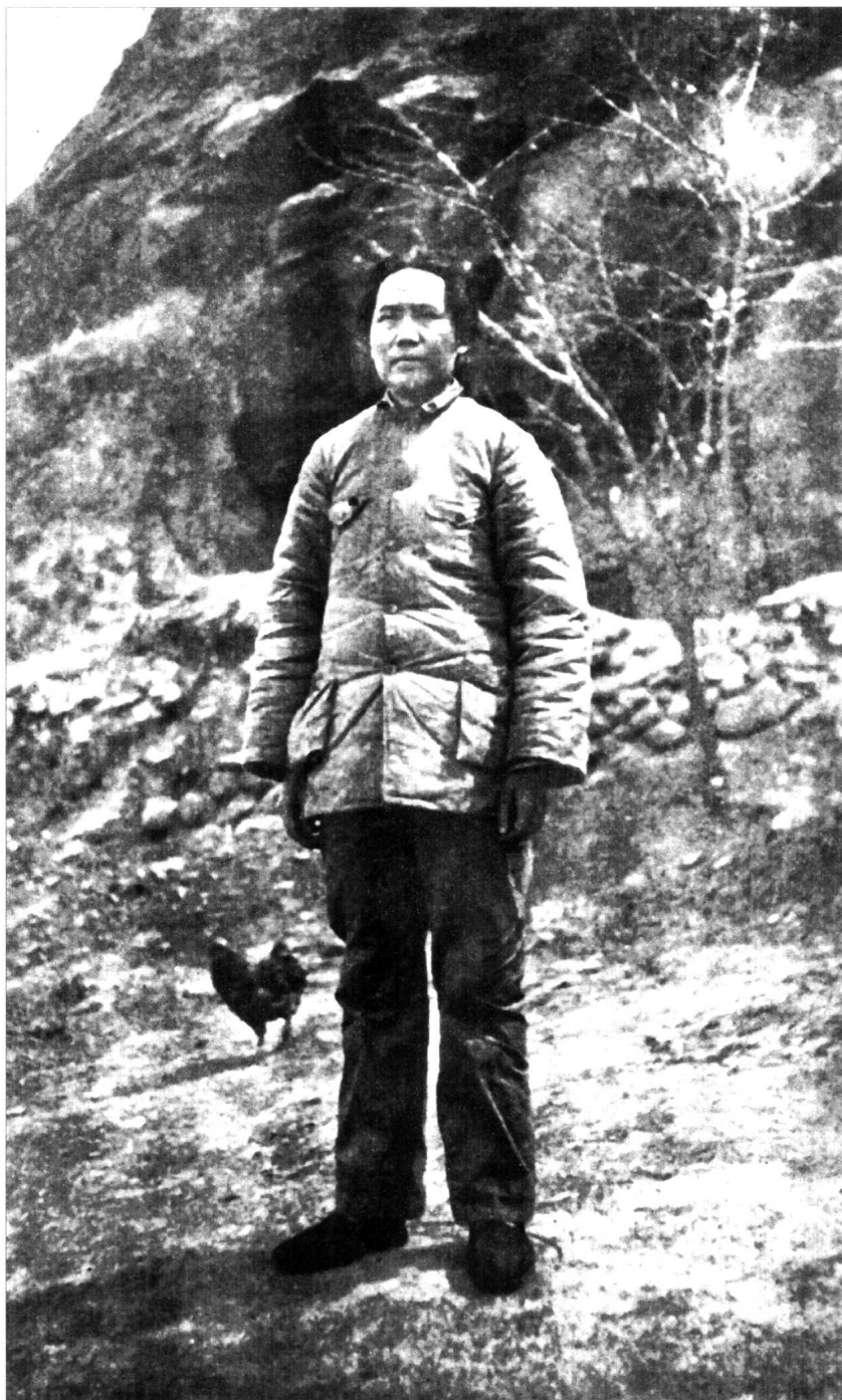
毛泽东在陕北农家小院（1937年）