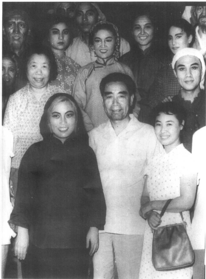
纪念毛泽东《在延安文艺座谈会上的讲话》二十周年演出歌剧《白毛女》后周总理与王昆、郭兰英等同志合影。