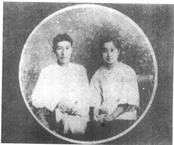
柳直荀烈士和李淑一同志订婚合影