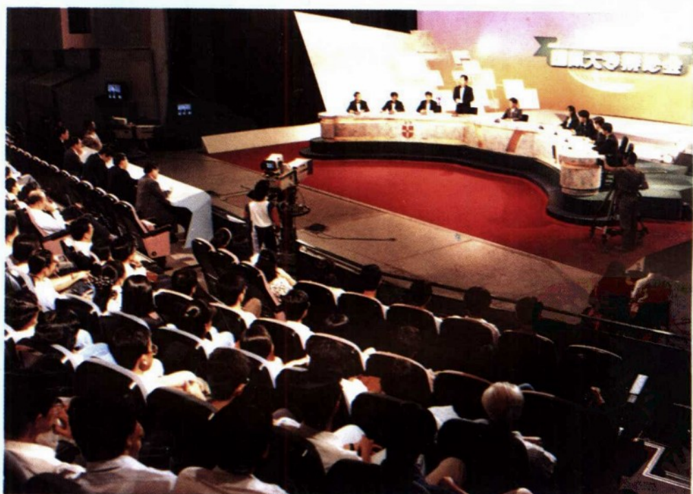
新加坡首届国际大专辩论会现场 剑桥大学队——复旦大学队