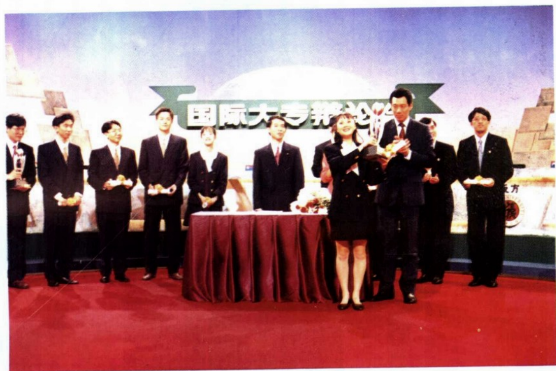
国际大专辩论会发奖现场： 复旦队姜丰从新加坡副总理李显龙手中接过团体冠军奖杯