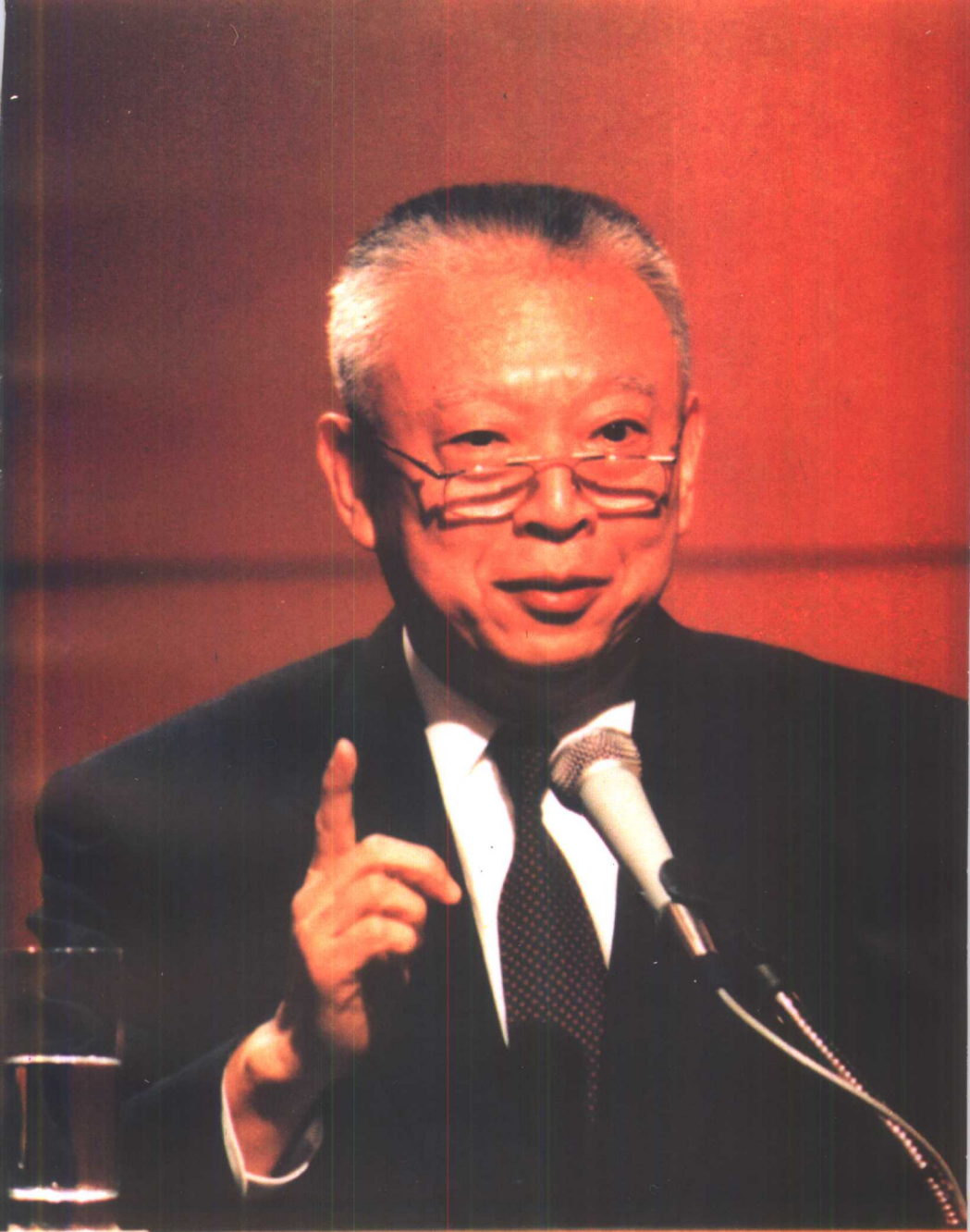
从容不迫侃侃而谈的董建华。