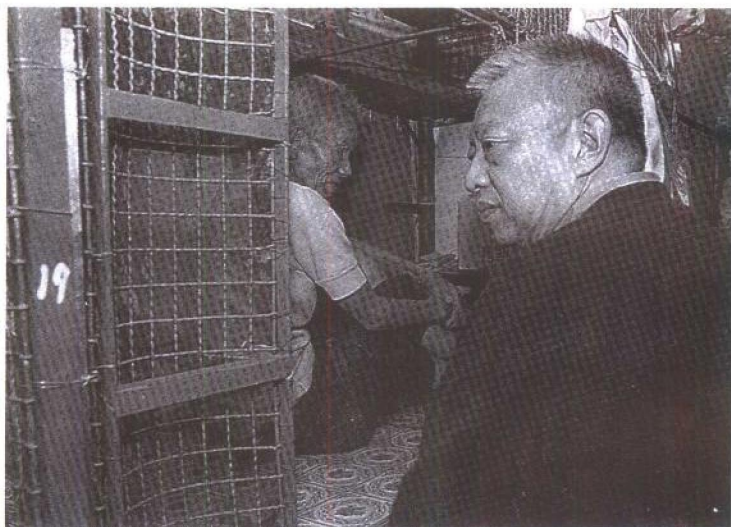
董建华体验基层生活,探望香港一名老年笼民。