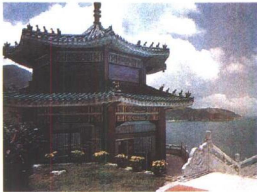
董家别墅香岛小筑是董家接待贵宾的首选地方。