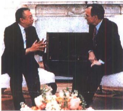
董建华与美国前总统布什私交甚厚。