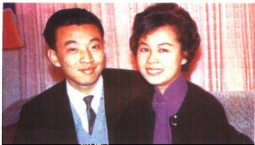
年轻时代的董建华夫妇。