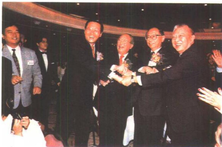
四位热门香港首届行政长官参选人齐齐握手。