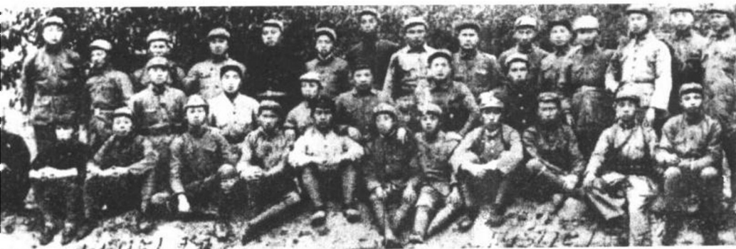
一九三七年五月一日，红四方面军第四军党代会代表在延安合影