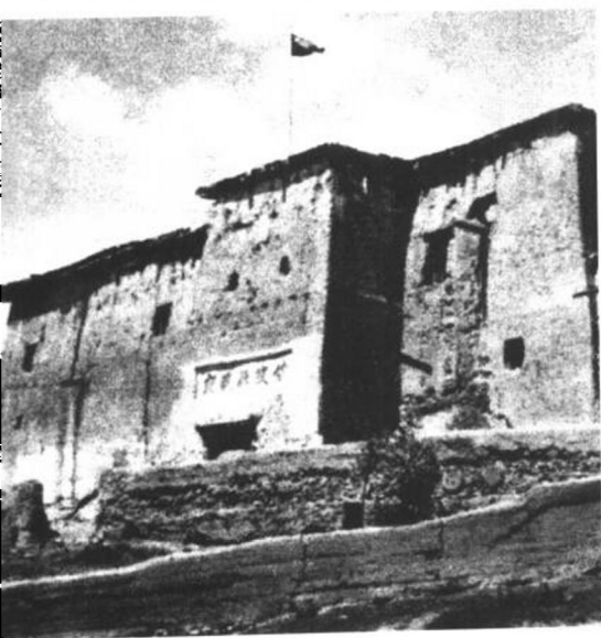
甘孜。一九三六年六月红二、四方面军在这里会合

腊子口。一九三五年九月，中央红军到达四川通往甘肃的要隘腊子口。山口宽约三十米，两边悬崖陡壁。敌人妄想凭借这一天险堵截红军北进道路，红军将其一举突破。