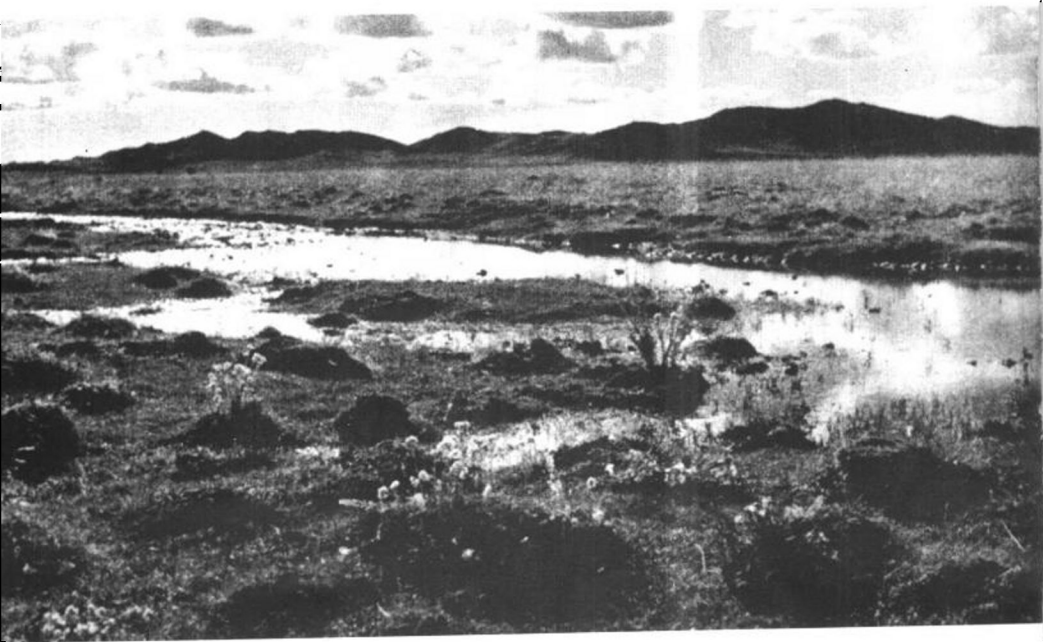
红军走过的水草地

红四方面军广大指战员反对张国焘的分裂主义路线，积极拥护毛泽东同志的北上抗日路线。这是他们在草地写的标语。