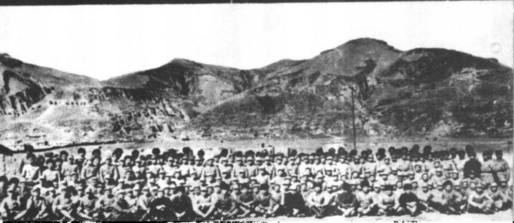
李先念率领西路军部分指战员，在党中央关怀下，由新疆迪化（今乌鲁木齐）回到延安