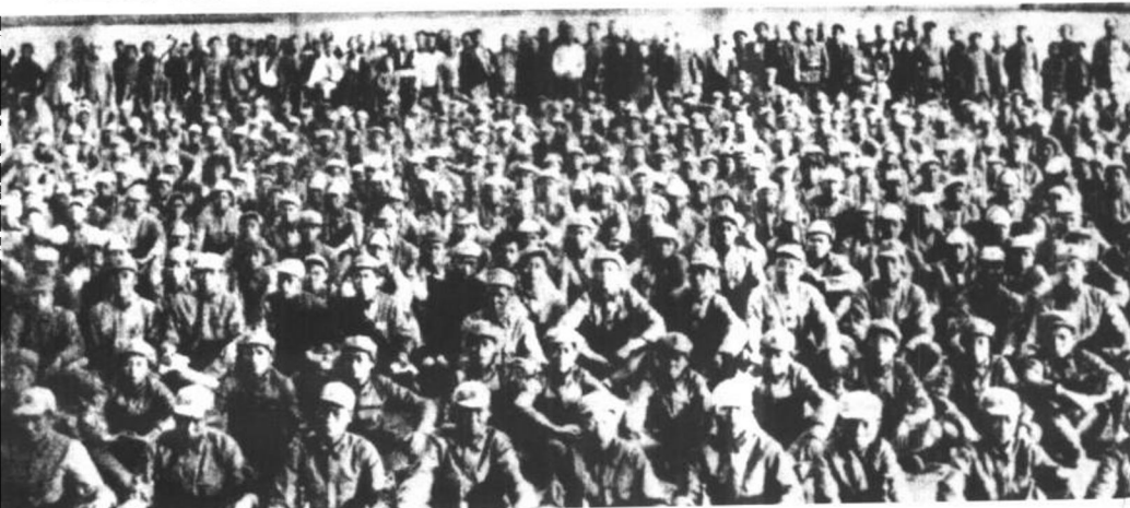
到达陕北的红四方面军一部