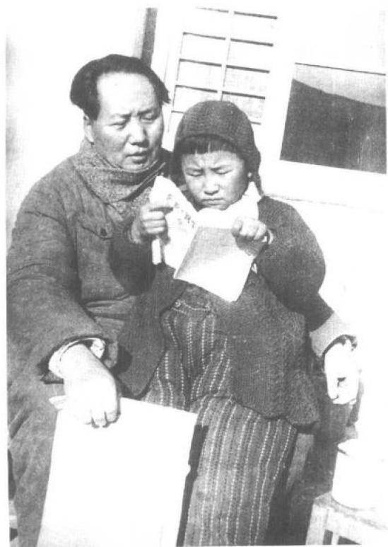
◀ 1946年，父亲毛泽东在延安窑洞前教我的妹妹李讷识字。