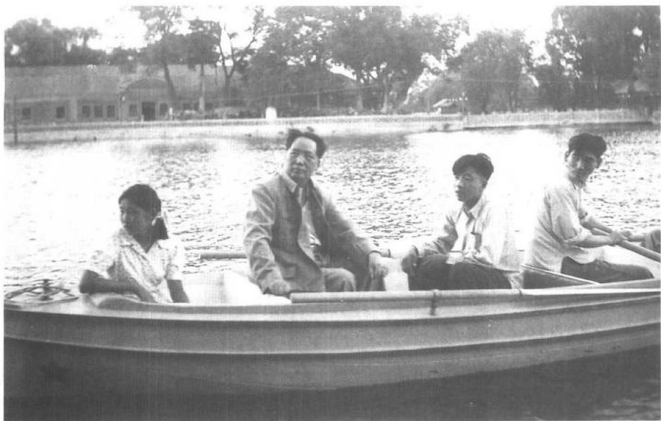
▲ 1951年6月5日，父亲带我在中南海划船。