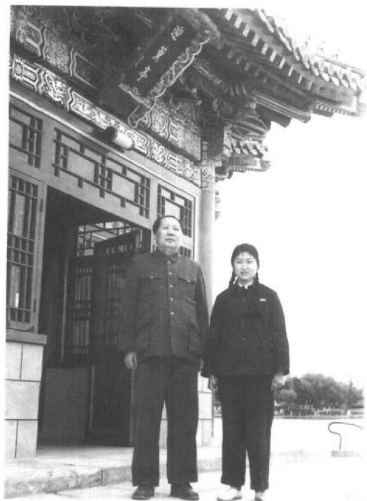
◀ 1953年4月12日，父亲与我在中南海瀛台。