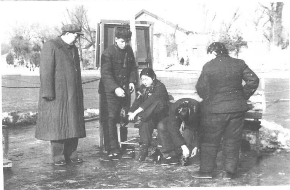
▼ 1953年1月4日，父亲来看我和妹妹李讷学滑冰。