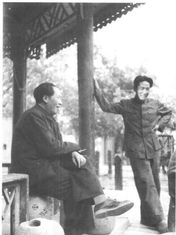
◀ 1949年，父亲毛泽东与我大哥毛岸英在北平香山。