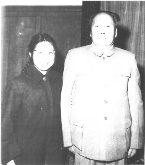
▶ 1961年2月23日，父亲与我在中南海住地合影。