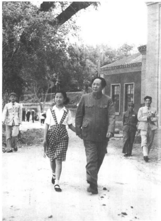
◀ 1951年，父亲与我的妹妹李讷在中南海散步。