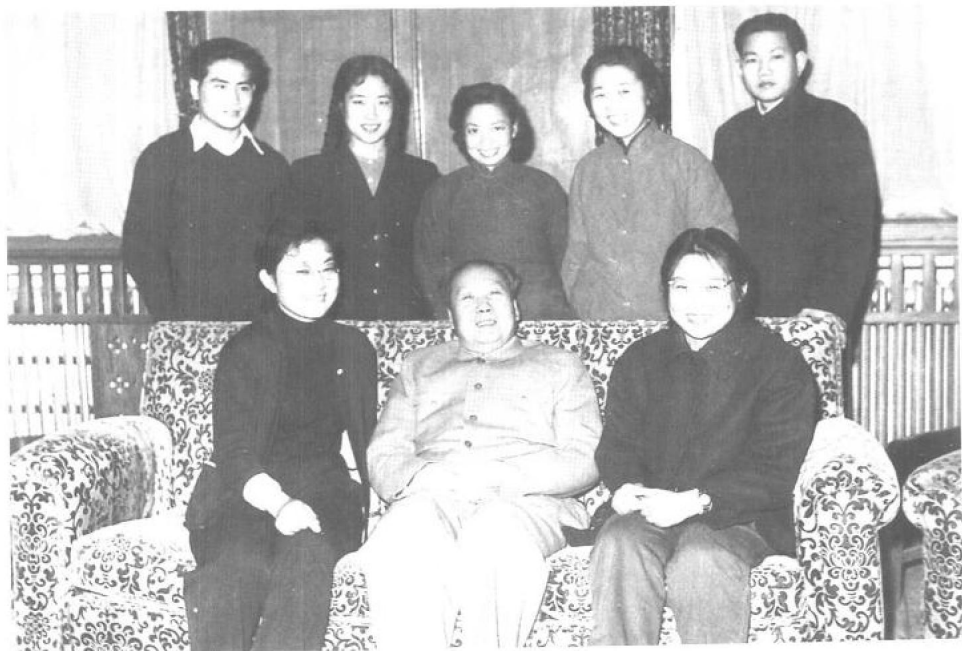
▲ 1961年2月23日，父亲与我及他身边的工作人员在中南海住地合影。