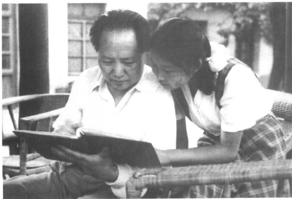
▼ 1951年夏，父亲同我在香山看照片。