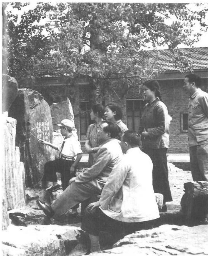
◀▼ 1953年5月30日，父亲与我、李讷、刘松林及身边工作人员在北京玉泉山。