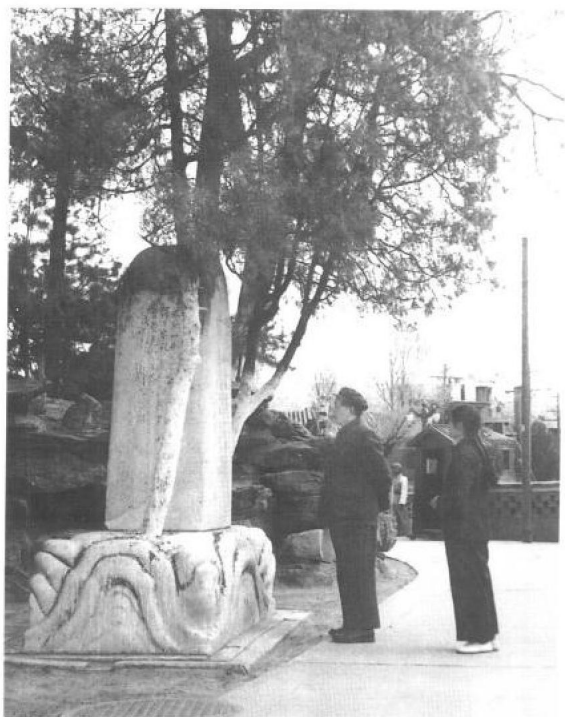
▶ 1953年4月12日，父亲带我在中南海看古碑文。