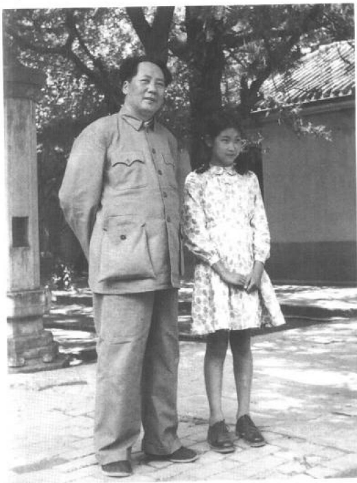
▶ 1949年7月，父亲与我 在香山。