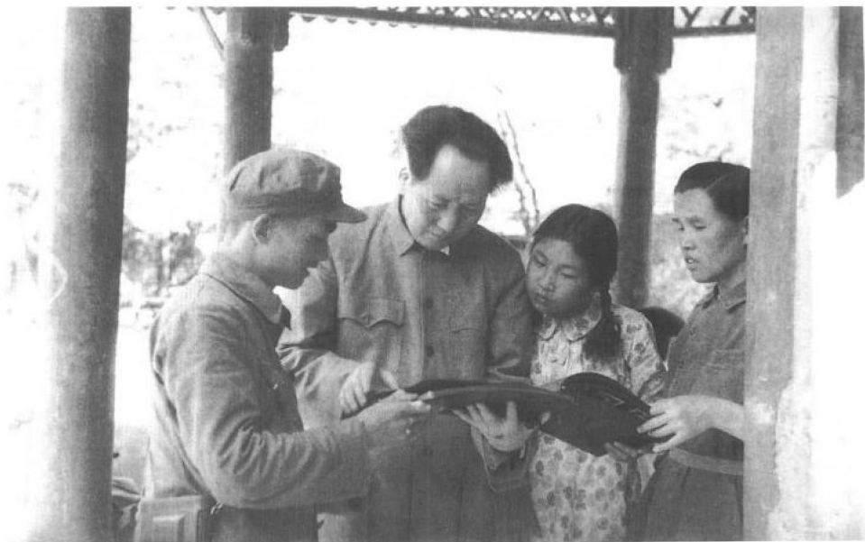
▲ 1949年7月，父亲与我及他身边的工作人员在一起看照片。