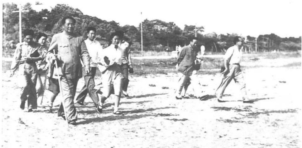
▲ 1954年7月，父亲与我及身边工作人员在北戴河。