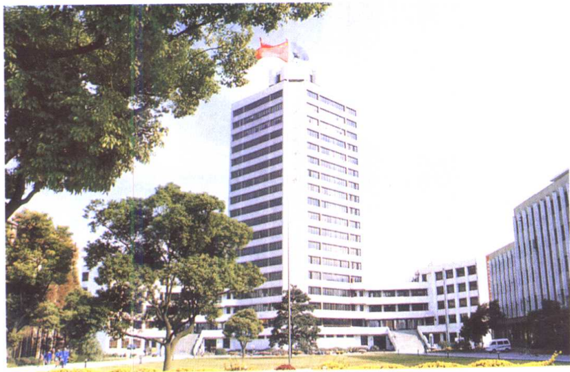
东 华 大 学 教 学 大 楼