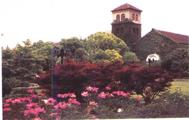
东 华 大 学 长 宁 路 校 区