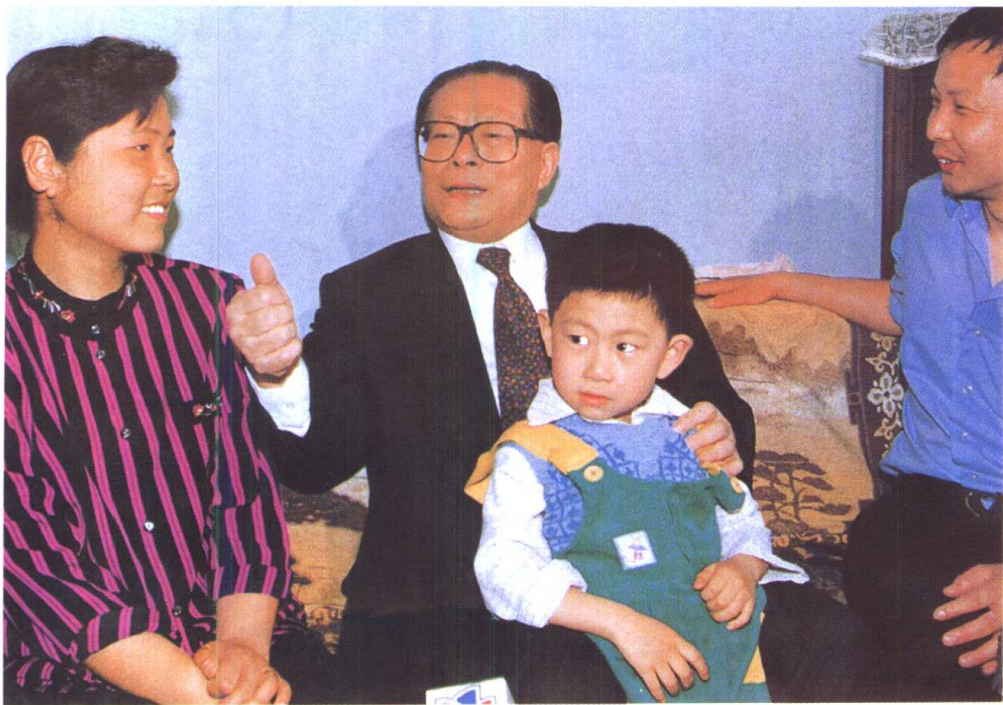
江泽民同志和东华大学“劳模班”学生杜玉英一家亲切交谈