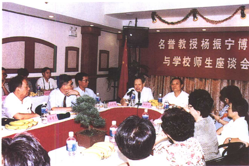
东华大学名誉教授杨振宁博士与东华大学师生座谈