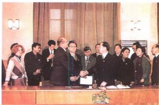
东华大学和莫斯科工业学院签订两校合作协议