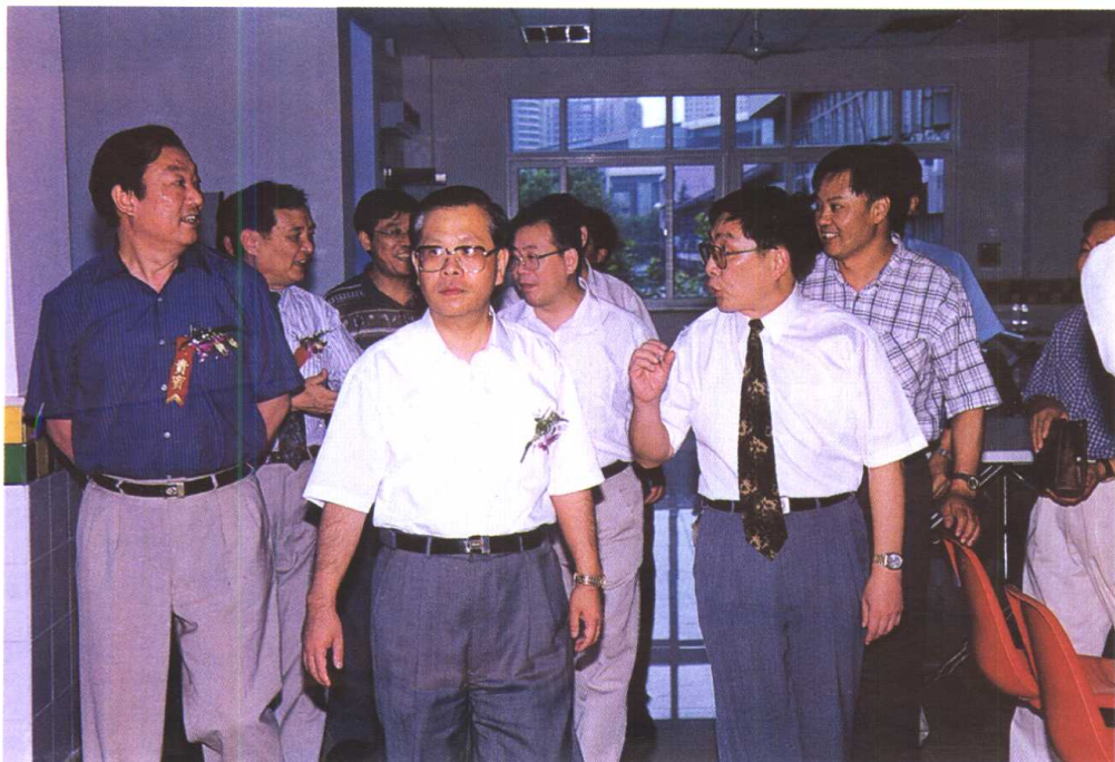
上海市委副书记龚学平、上海市副市长周慕尧视察东华大学