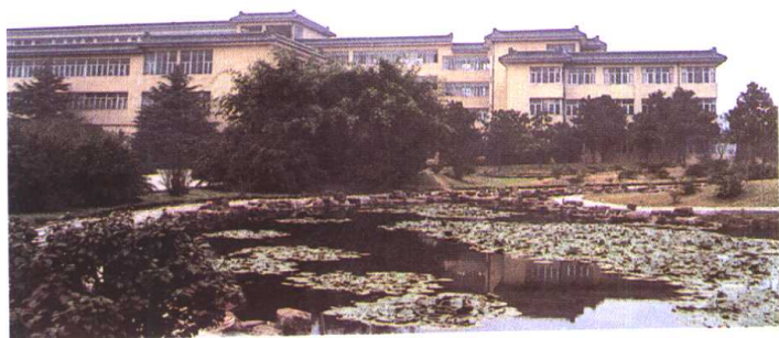
东 华 大 学 无 锡 校 区