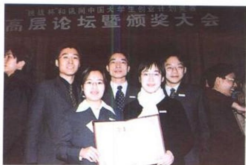
在“挑战杯”和和讯网中国大学生创业计划竞赛中，东华大学“医用甲壳质缝合线创业计划”荣获金奖