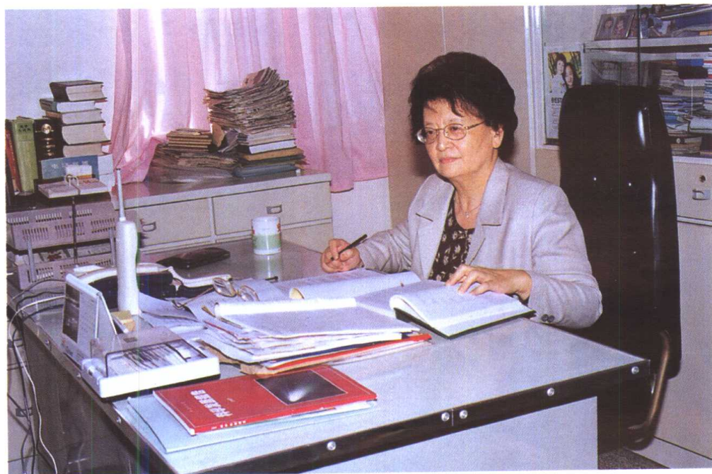
东华大学教授、中国工程院院士周翔