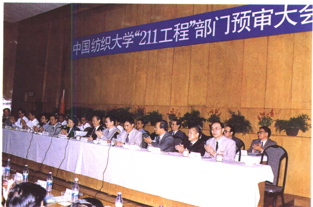
东华大学（原中国纺织大学）顺利通过“211工程”部门预审