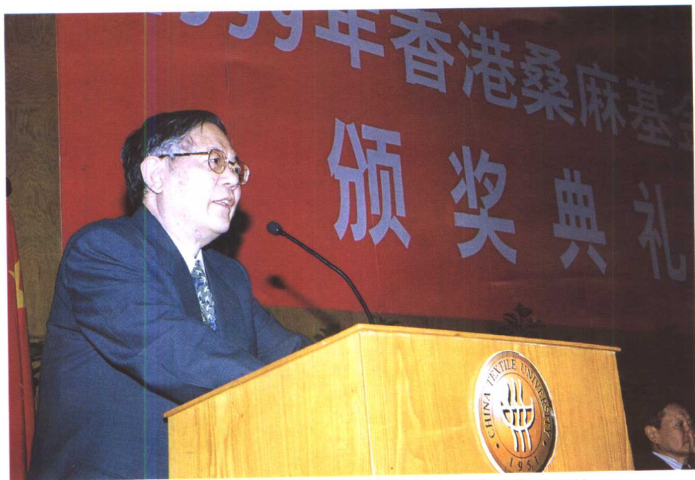
全国人大常委会副委员长周光召出席在东华大学举行的 香港桑麻基金颁奖仪式，并在会上作了重要讲话