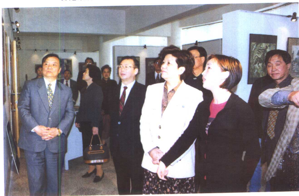
教育部部长陈至立视察东华大学