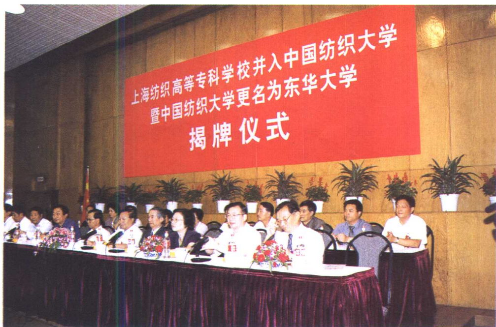
上海纺织高等专科学校并入中国纺织大学，中国纺织大学更名为东华大学