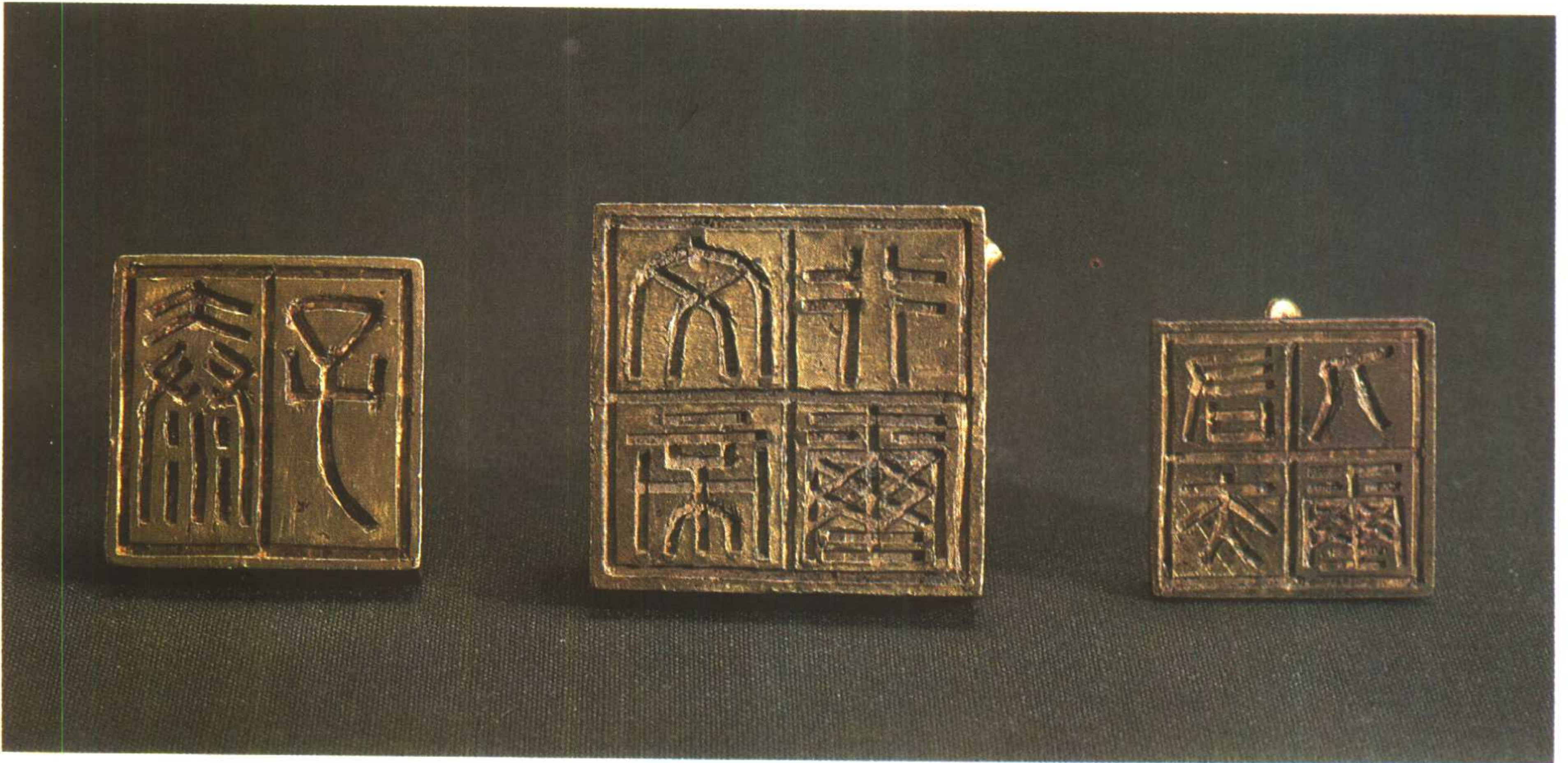
金印：“秦子”(D81)、“文帝行玺”(D79)、“右夫人玺”(E90)