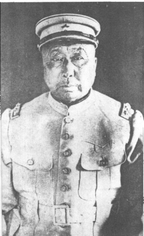
黑龙江督军吴俊升。