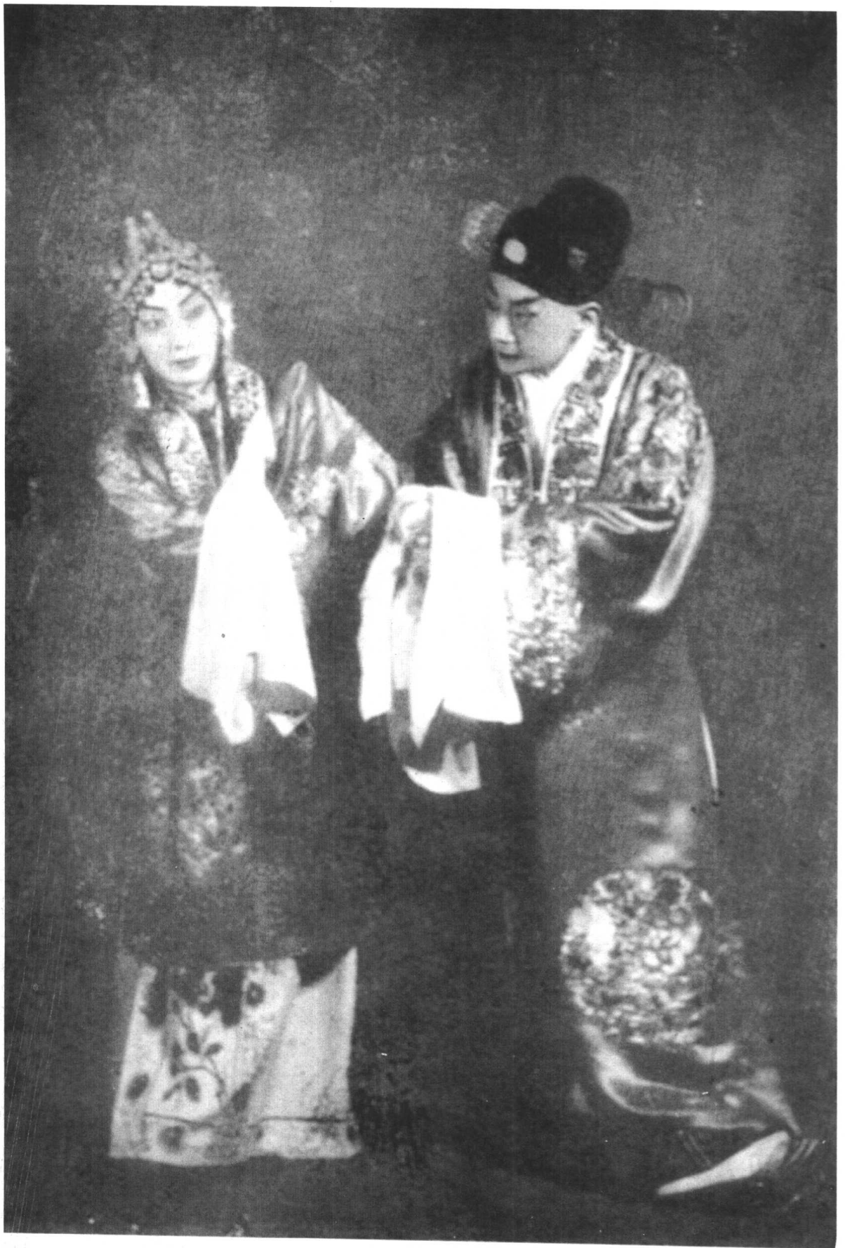
《贩马记·写状》 梅兰芳饰李桂枝 俞振飞饰赵 宠