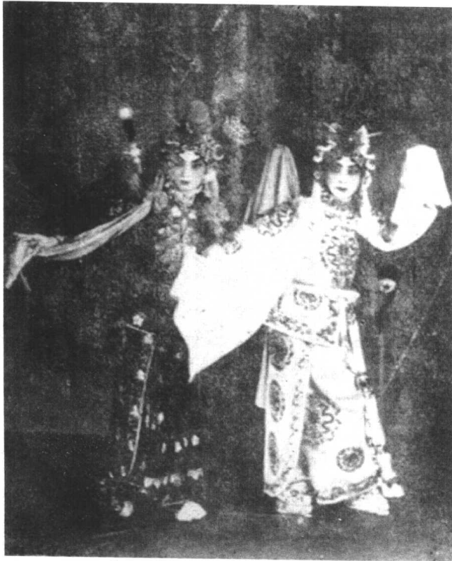
《金山寺》 梅兰芳饰白素贞 梅葆玖饰小青