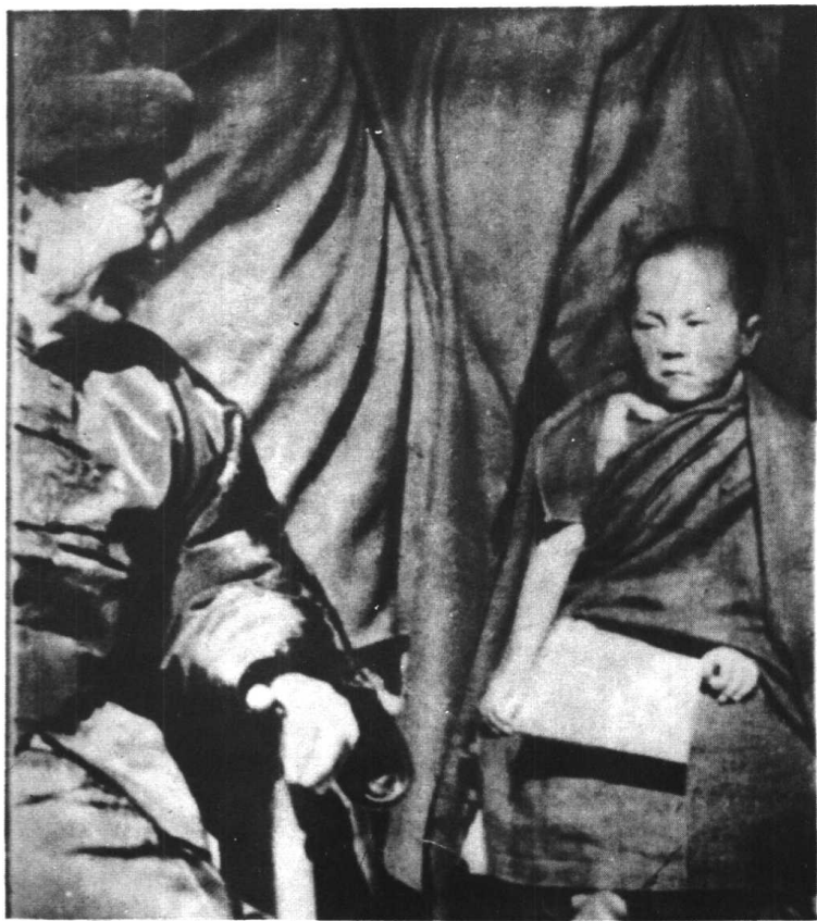
1940年2月22日十四世达赖喇嘛坐床之前，国民政府专使吴忠信确认灵童。图左为吴忠信，右为拉木登珠。