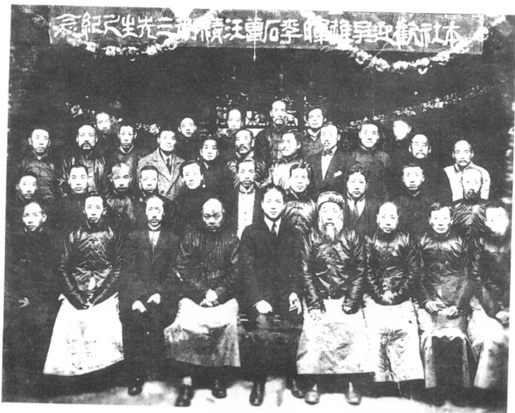
▽ 景梅九与吴稚晖、李石曾、汪精卫等合影