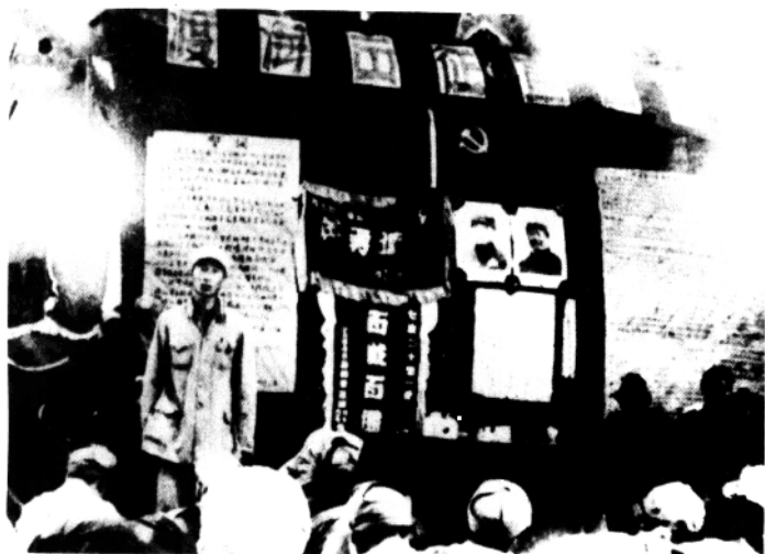
第一二七师第三八〇团一连,进行渡海作战动员。

第四十三军机帆船改装股全体人员完成海南昌战前装 船任务摄影纪念 一九五〇年五月十一日於雷州半岛