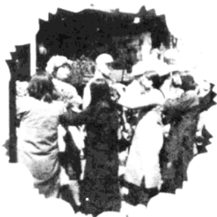
1947年春，榆樹某村的群眾為第六縱隊的英雄、功臣戴花。