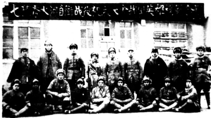
第七旅秀水河子战斗英雄、模范合影