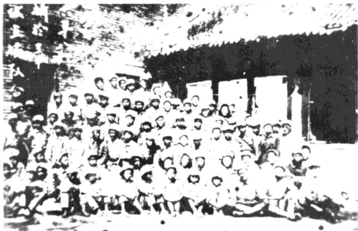
第六縱隊第十六師宣傳隊經常深入部隊開展宣傳鼓動工作。照片為部分宣傳隊員合影。