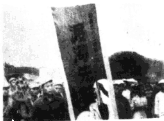
第一二八师第三八三团一营在渡海作战中，被军授予“渡海先锋营”荣誉称号。