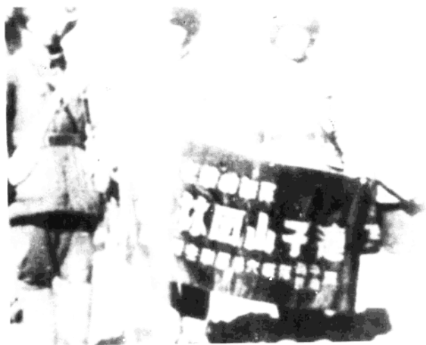
在1947年东北秋季攻势作战中，第十七师第四十九团九连攻克团山子，荣获“吉林团山子连”称号。