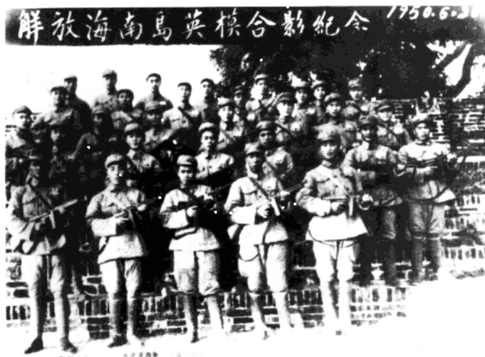
第四十三军部分渡海作战英模合影。