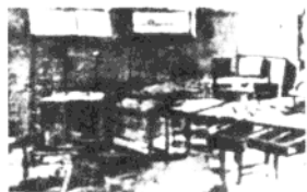
照片為1947年四平攻堅戰中，第十七師攻佔第七十一軍軍長的辦公室。