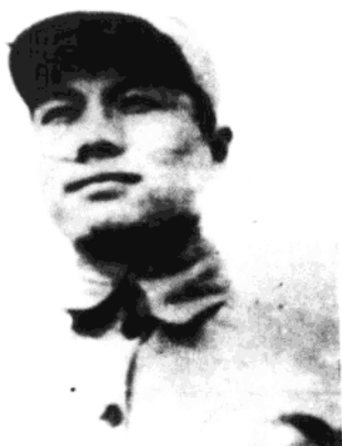
第十七师第四十九团政治委员杨耀典， 在1948年10月锦州攻坚战中牺牲。