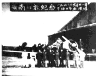
海南岛解放后，在海口市召开了隆重的庆功大会。照片为部分军、师领导在海口市飞机场合影。