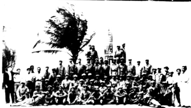
为适应渡海作战的需要,改装了部分机帆船。 照片为机帆船改装股全体人员完成装船任务后合影。

第四十三军机帆船改装股全体人员完成海南昌战前装 船任务摄影纪念 一九五〇年五月十一日於雷州半岛