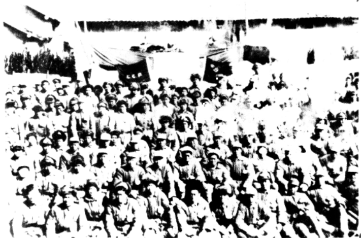
1947 年三下江南作战结束后，第四十七团在三岔河召开庆功大会，表彰作战有功人员。