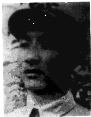
第一二九师第三八六 团政治委员李荣桂，在1949 年5月渡江作战中牺牲。