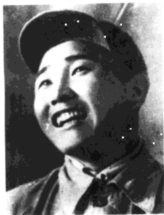
第十六师第四十六团 政治委员张天涛，在1948 年10月辽西会战中牺牲。