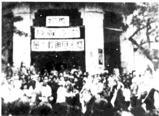
1949年12月，第一二八师解放湛江市。照片为战后与群众一起联欢，庆祝湛江市解放。