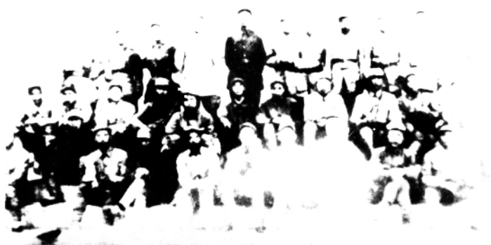
第七师第十九旅营以上干部合影