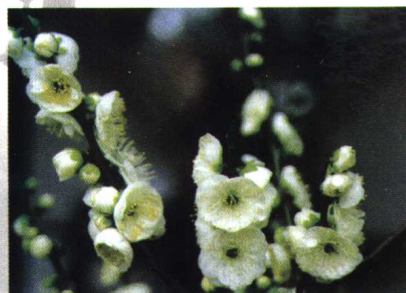
小绿萼 (真梅系直枝梅类绿萼型)