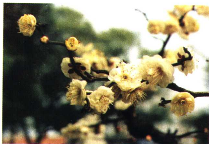
龙游梅 (真梅系玉蝶龙类游梅型)