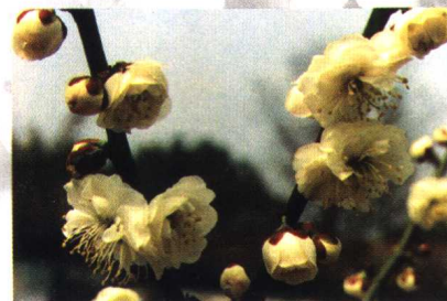
徽州檀香 (真梅系直枝梅类玉蝶型)