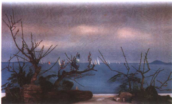
梅花写意盆景：东湖春晓