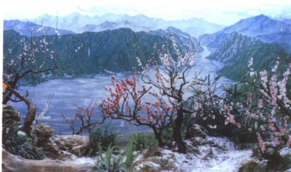
梅花写意盆景：梅雪争春