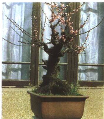
梅花盆景的自然式造型：露根梅