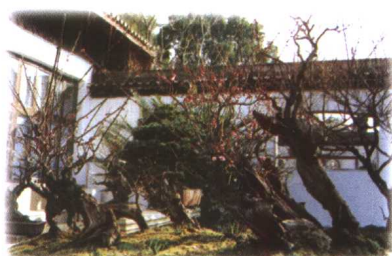
梅花盆景艺术流派：劈梅