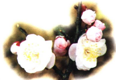
淡丰后 (杏梅系杏梅类丰后型)