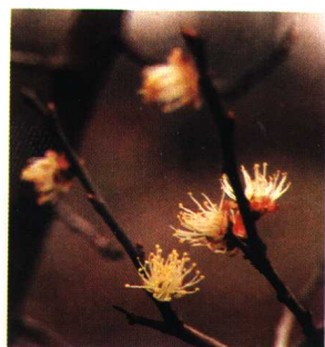
邠悬梅 (直枝梅类细梅型)