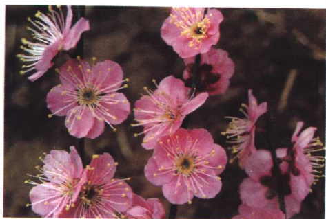
六瓣红 (真梅系直枝梅类江梅型)