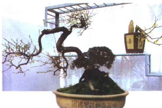
梅花盆景的自然式造型：露根曲干梅