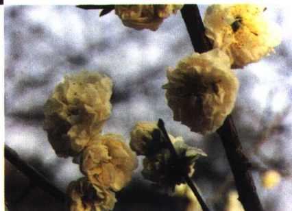
黄金鹤 (真梅系直枝梅类黄香型)