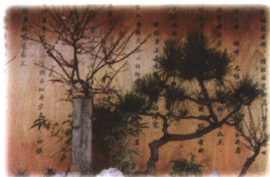
梅花盆景艺术流派：劈梅