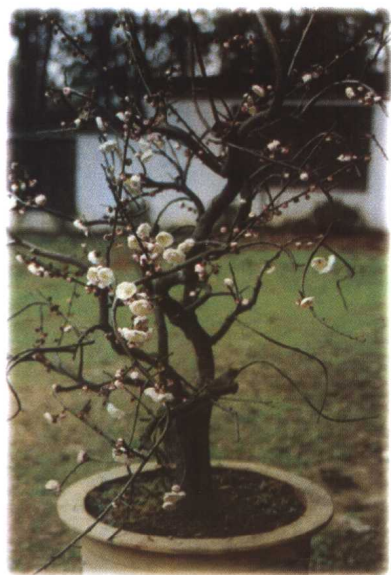
梅花盆景的艺术流派：四川风格