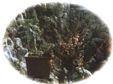
梅花盆景的自然式造型：悬崖梅