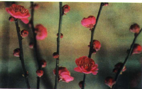
锦红垂枝 (真梅系垂枝梅类骨红垂枝型)