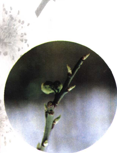
并蒂台阁绿萼 (真梅系直枝梅类绿萼型)