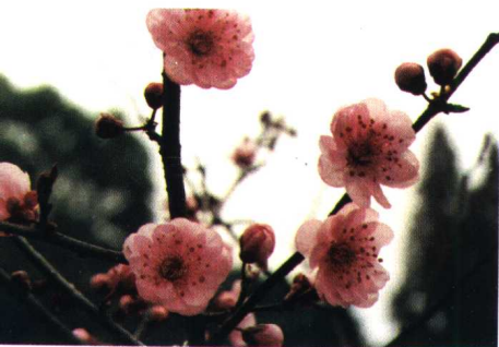
美人梅 (樱李梅系樱李梅类美人梅型)