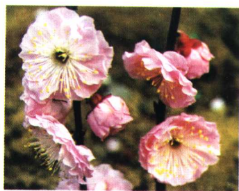
送春 (杏梅系杏梅类送春型)