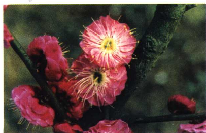
大朱砂 (真梅系直枝梅类朱砂型)