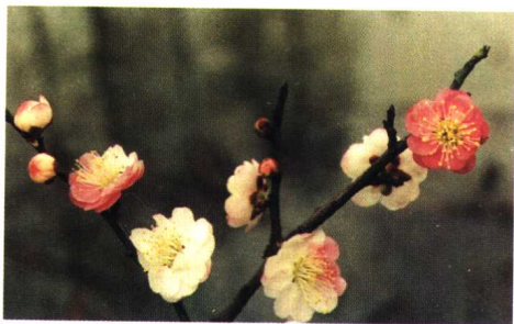
晚跳枝 (真梅系直枝梅类洒金型)