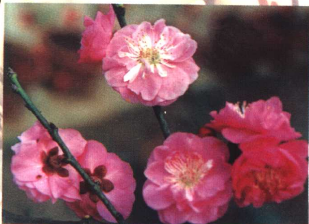
清明晚粉 (真梅系直枝梅类宫粉型)