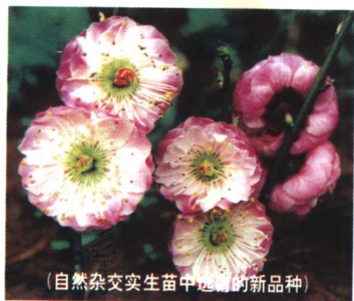
(自然杂交实生苗中选育的新品种)