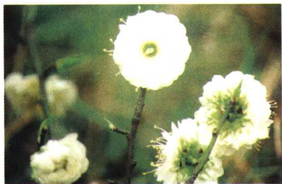
金钱绿萼 (真梅系直枝梅类绿萼型)