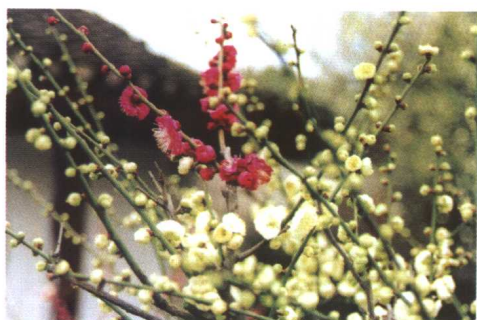
绿梅上嫁接的红梅