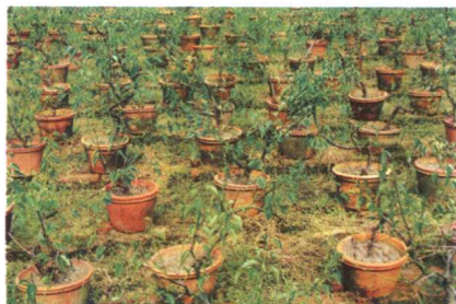
夏天盆梅管理不善，落叶严重