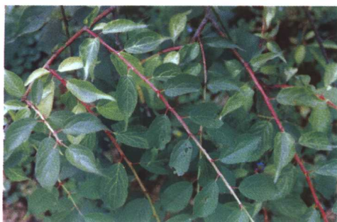
锦生垂枝的新枝叶有别于其他梅（锦生垂枝）