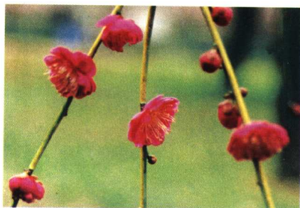
锦生垂枝 (真梅系垂枝梅类骨红垂枝型)