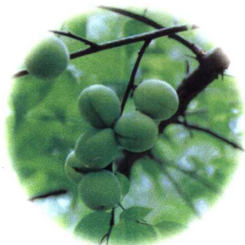
粉皮垂枝 品字梅果