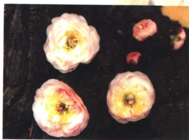
贵妃台阁 (真梅系直枝梅类宫粉型)