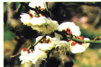
素白台阁 (真梅系直枝梅类玉蝶型)