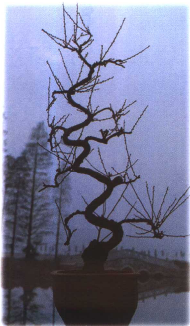
梅花盆景的艺术流派：游龙梅