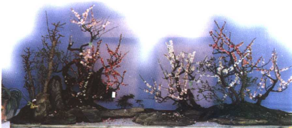
梅花写意盆景：暗香浮动