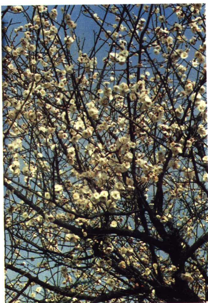
密梅状态 (宫粉型 早凝馨)