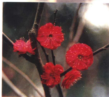
南京红颜 (真梅系直枝梅类朱砂型)