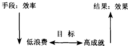
图 1-1 管理追求效率和效果

第四，管理最终要落实到计划、组织、领导和控制等一系列管理职能上。管理职能是管理者开展管理工作的手段和方法，也是管理工