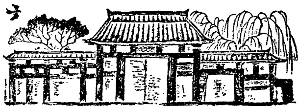
中国汉代的封建庄园(根据西南博物馆汉代墓砖绘制)

第一,在封建社会初期,城市人口很少,农民占大多数,社会生产以农业生产为主体,手工业只是农业的从属。每一个封建领主在占有的土地上建立自己的封建庄园。封建庄园是当时自然经济的基层机构,封建领主完全依靠农业和手工业所生产的東西自给自足,很少有同外界交换商品的关系。