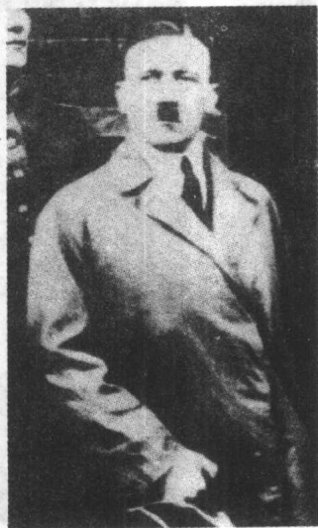
◀啤酒馆政变后入狱