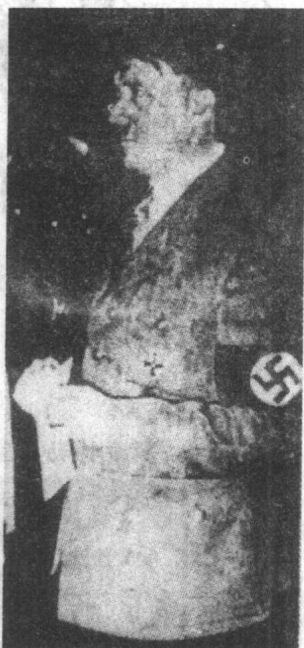
▲1934年任总理满一周年 时的希特勒