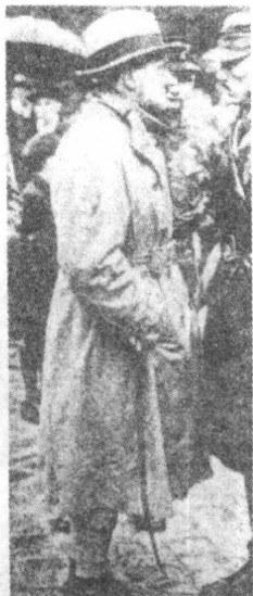
▲1926年希特勒接管「纳粹党」的宣传工作