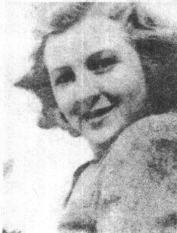
▼ 希特勒的情妇爱娃