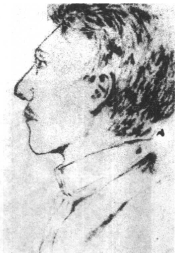
◀ 希特勒15岁时，他的同学给他画的肖像素描