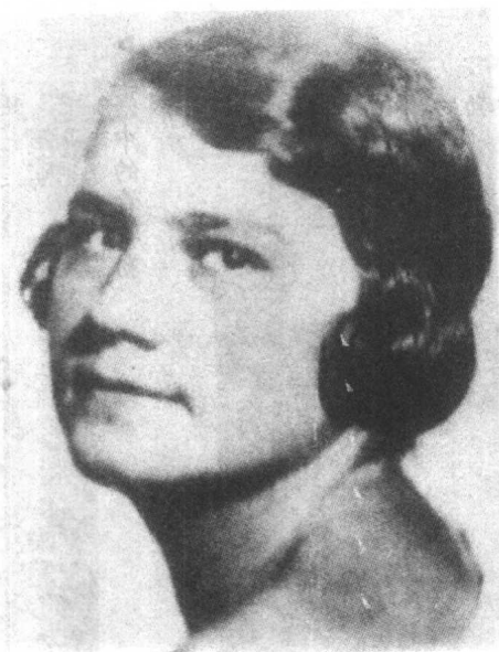
▶ 希特勒「外甥女」兼情妇吉莉