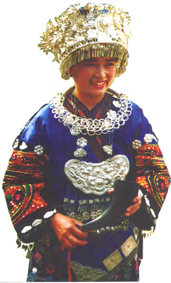
① 比美 ◎ 雷山丹江苗族女盛装