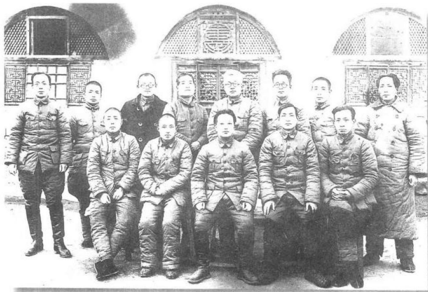
向来以“左”著称的王明回国后，却以另一番形象出现在全党面前。在1937年12月中共中央政治局会议上提出了右的主张。毛泽东说：十二月会议我是孤立的。图为与会者的合影。前排右3为王明，后排右1为毛泽东。