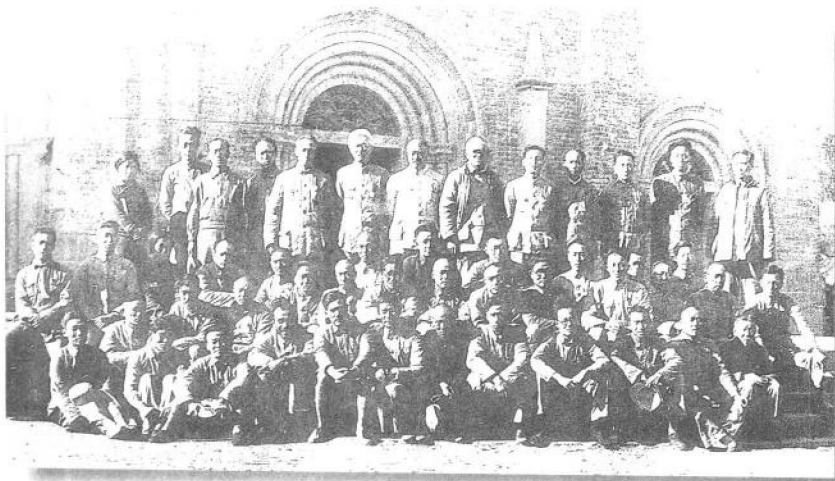
1938年9月29日至11月6日，中共六届六中全会在延安举行。毛泽东在会上告诫全党：必须使马克思主义在中国具体化，教条主义必须休息。图为与会者的合影。第三排左7为王明，第四排右1为毛泽东。