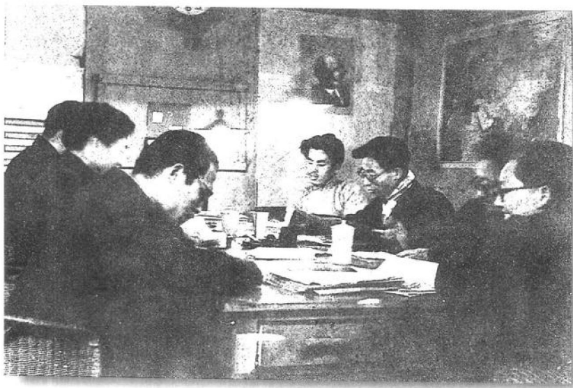
战斗在国民党统治区的中共中央南方局所属各系统的工作人员，以饱满的热情投入整风运动。图为重庆《新华日报》编辑部的工作人员在进行整风学习。

康生同志： 七月一日 为时： 西康系统： 正确路线是：首重党员，自己动手，调查研究，广泛群众相结合，个别指导相结合，调查研究，分清是非轻重，争取主动，培养干部，反对官僚主义。 个别同志体定：逼、供、信。 我们应当反对错误路线，反对官僚主义。