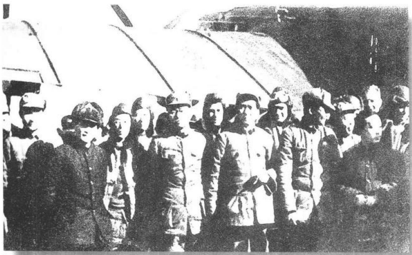
1937年11月29日，中共驻共产国际代表王明等由苏联回到延安。图为毛泽东等到机场欢迎王明等时的合影。前排右1为王明，右3为毛泽东。