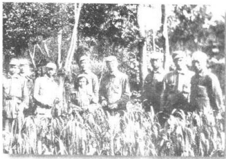
在整风运动中，调查研究蔚然成风。1942年1月至1943年3月，张闻天率调查团深入陕甘宁边区和山西兴县等地，进行调查研究。图为1942年9月16日张闻天同“延安农村工作调查团”成员在神府彩林村的合影。右4为张闻天、右6为张闻天的妻子刘英。