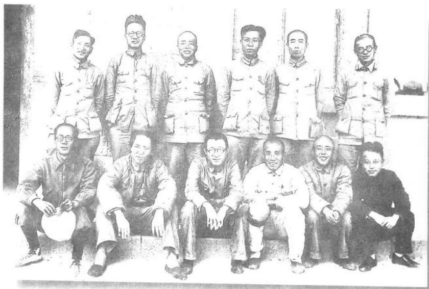
中共六届六中全会批评了王明的错误，确认了以毛泽东为首的中央政治局的政治路线，肯定了毛泽东在全党的领导地位。图为全会主席团的合影。前排右1为王明，右5为毛泽东。