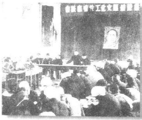
延安文艺座谈会的春风也吹到了各敌后抗日根据地。图为1944年晋冀鲁豫边区文化工作者座谈会的场景，中间站立作报告者为邓小平。