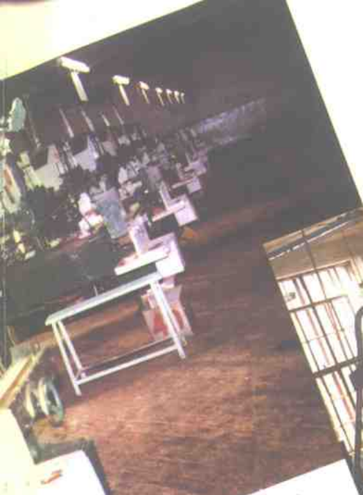
哈尔滨卷烟厂 (卷接车间)