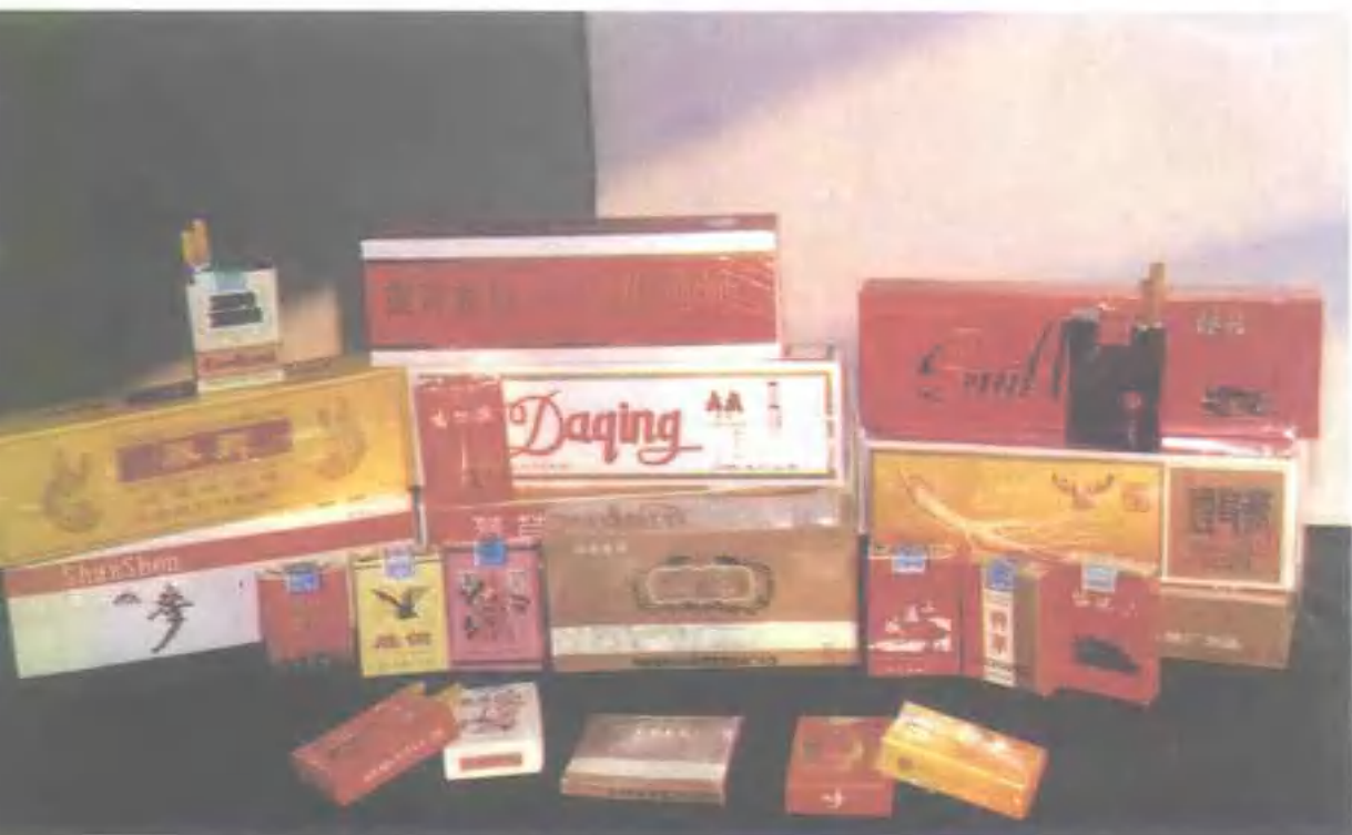
黑龙江省主要卷烟产品