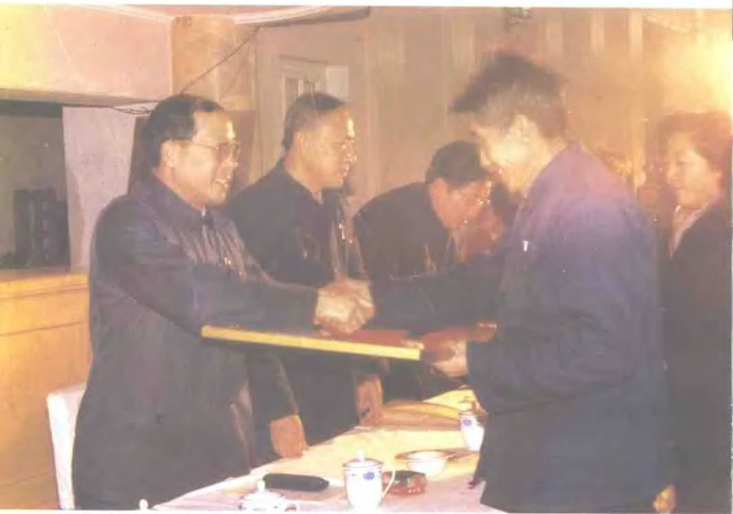
1985年末，黑龙江省召开全省烟叶工作经验交流会，刘仲黎副省长（左一）到会做了重要讲话，并为获奖单位颁奖