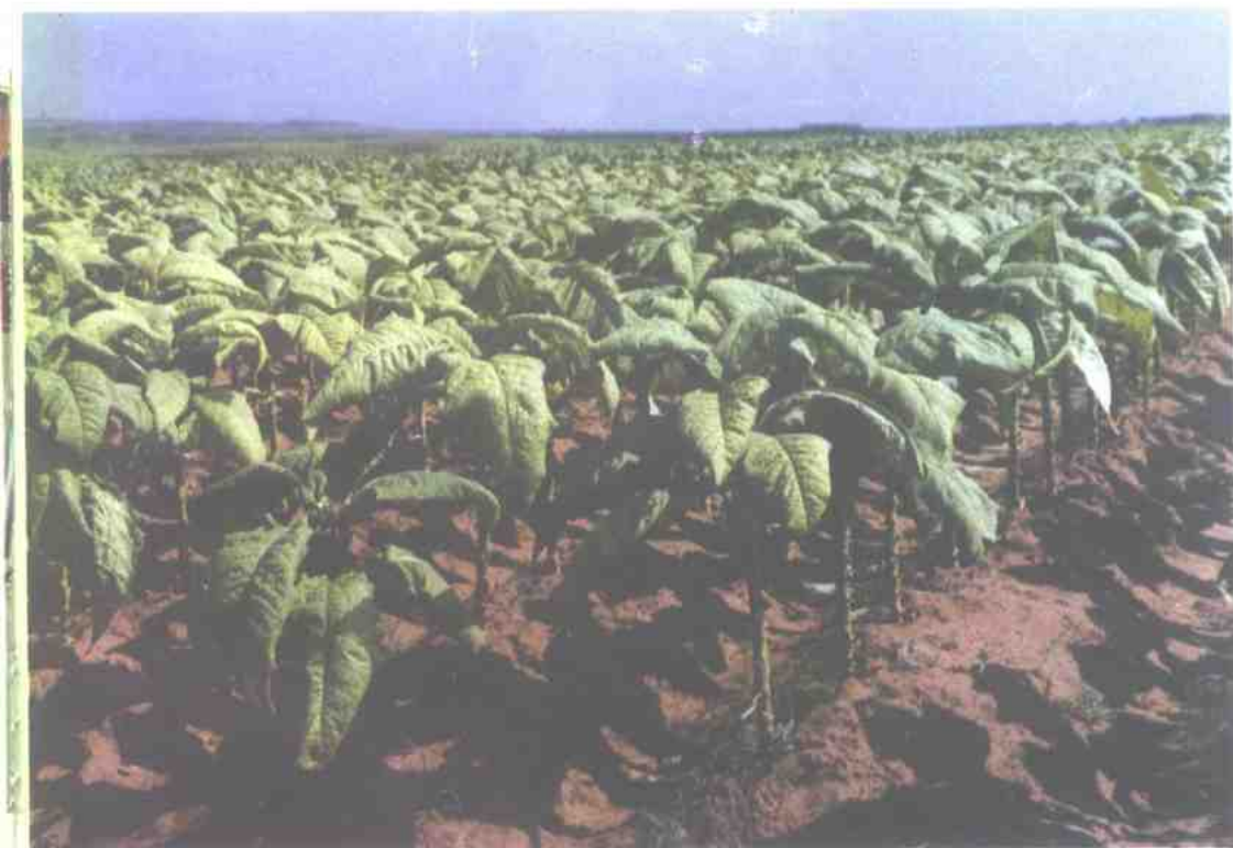
成熟采摘期烤烟田