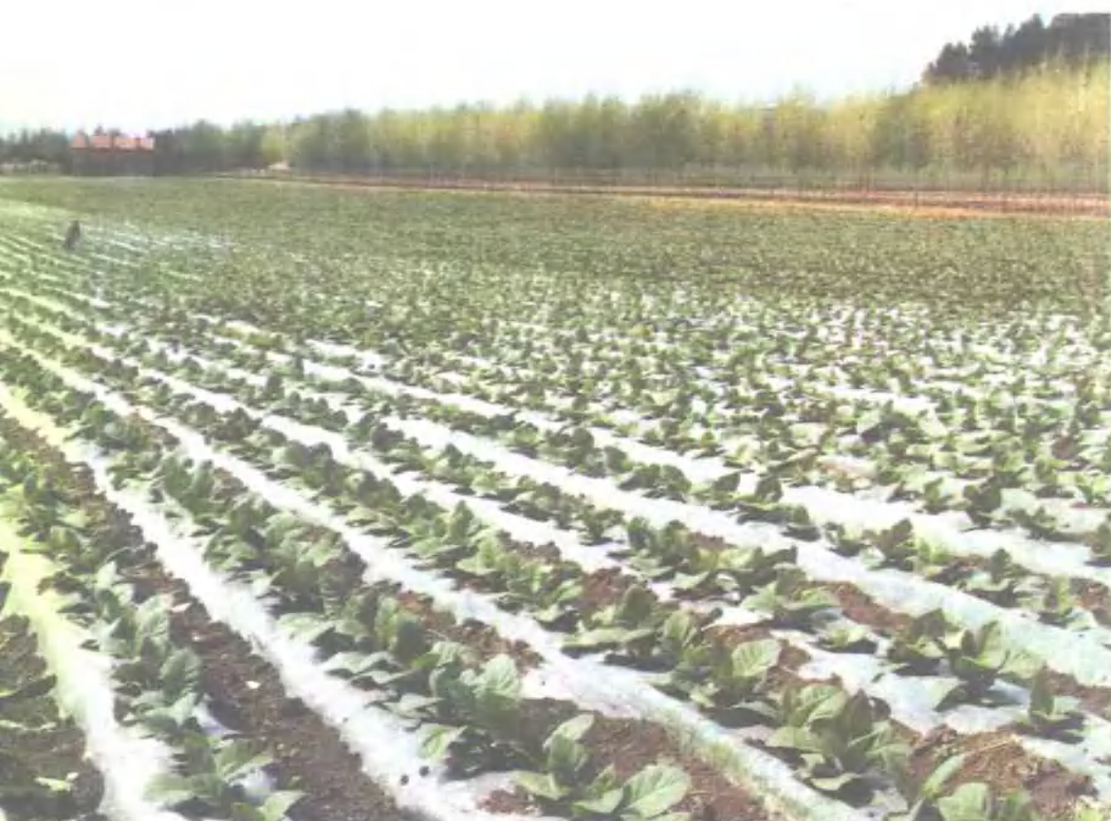
改良式地膜覆盖烤烟田