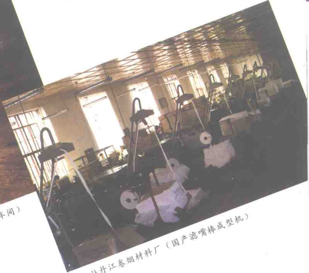
牡丹江卷烟材料厂 (国产滤嘴棒成型机)