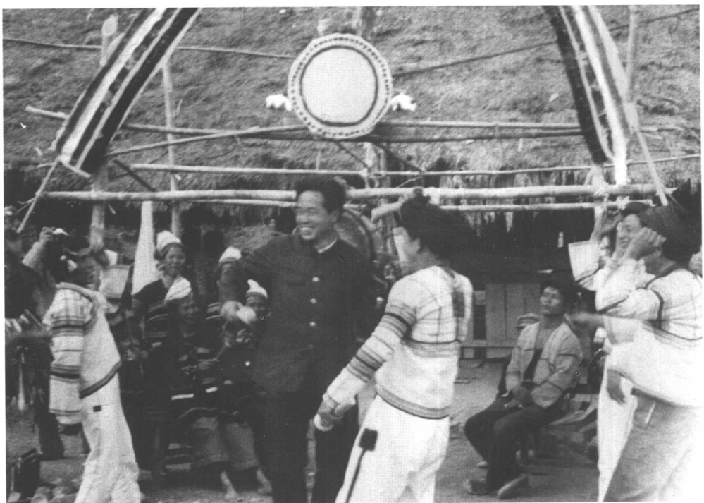
与基诺族群众共舞