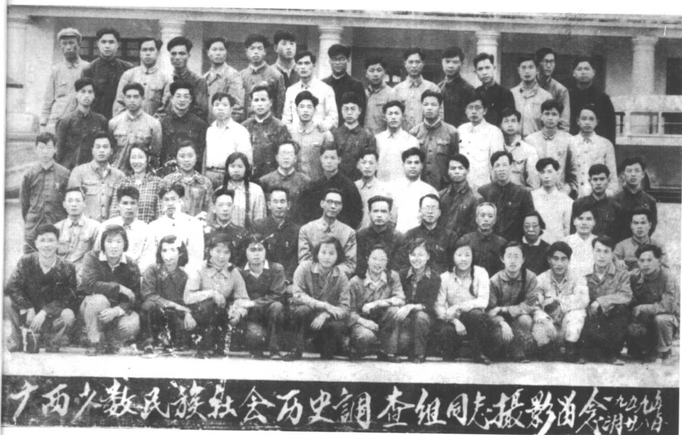
广西少数民族社会历史调查组合影