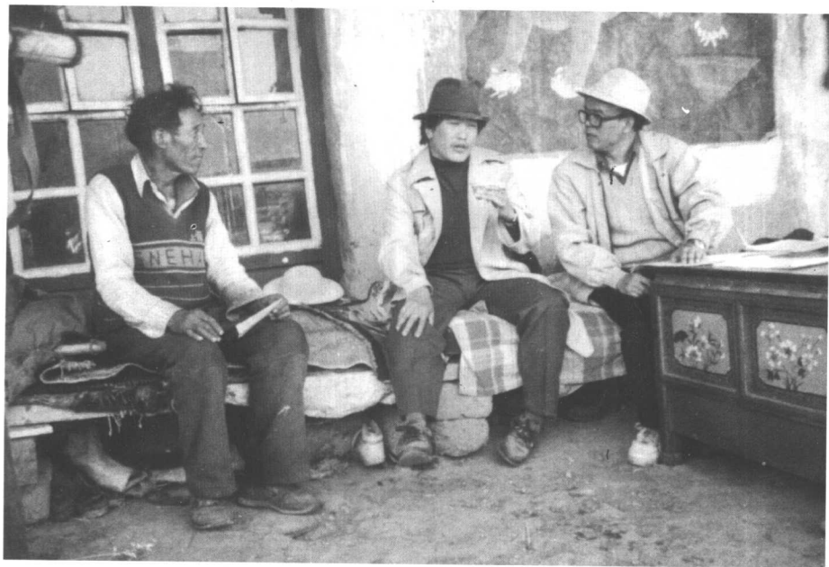
调查西藏人权状况