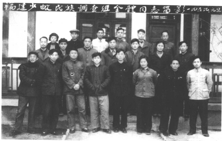
福建少数民族调查组全体合影