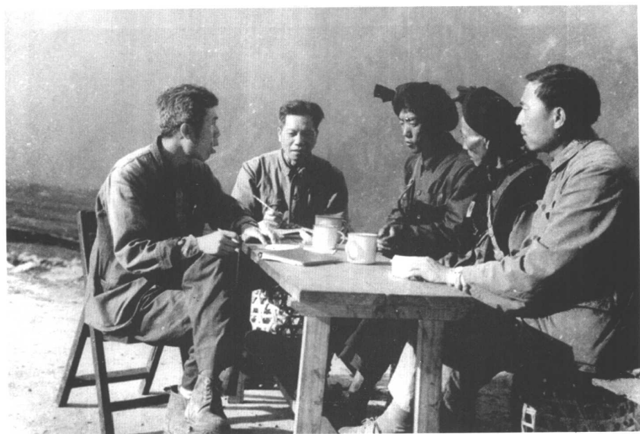
西藏察隅倮人语言调查