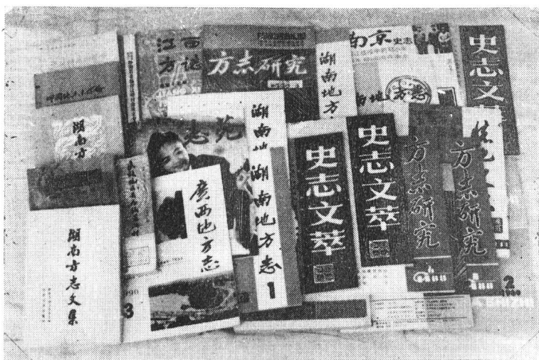
10 多家出版社、史志期刊，刊载周光烈作品的书刊。