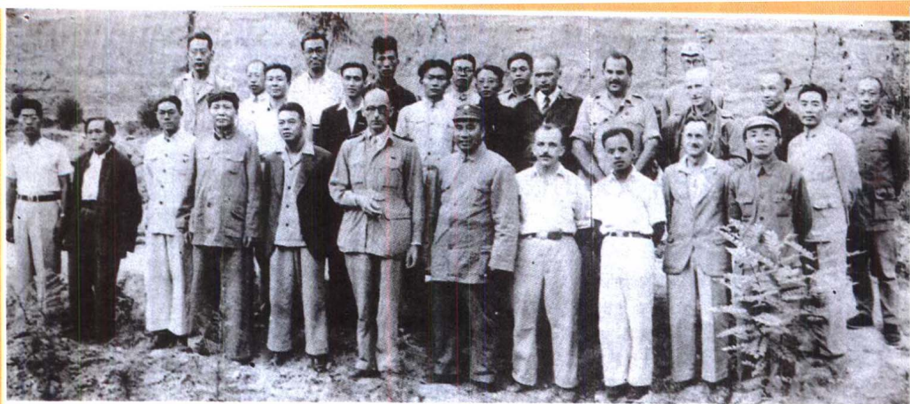
一九四四年，徐特立（左二）与毛泽东、朱德、周恩来等在延安会见中外记者团。