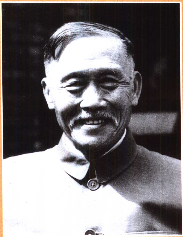
八十高龄的徐特立