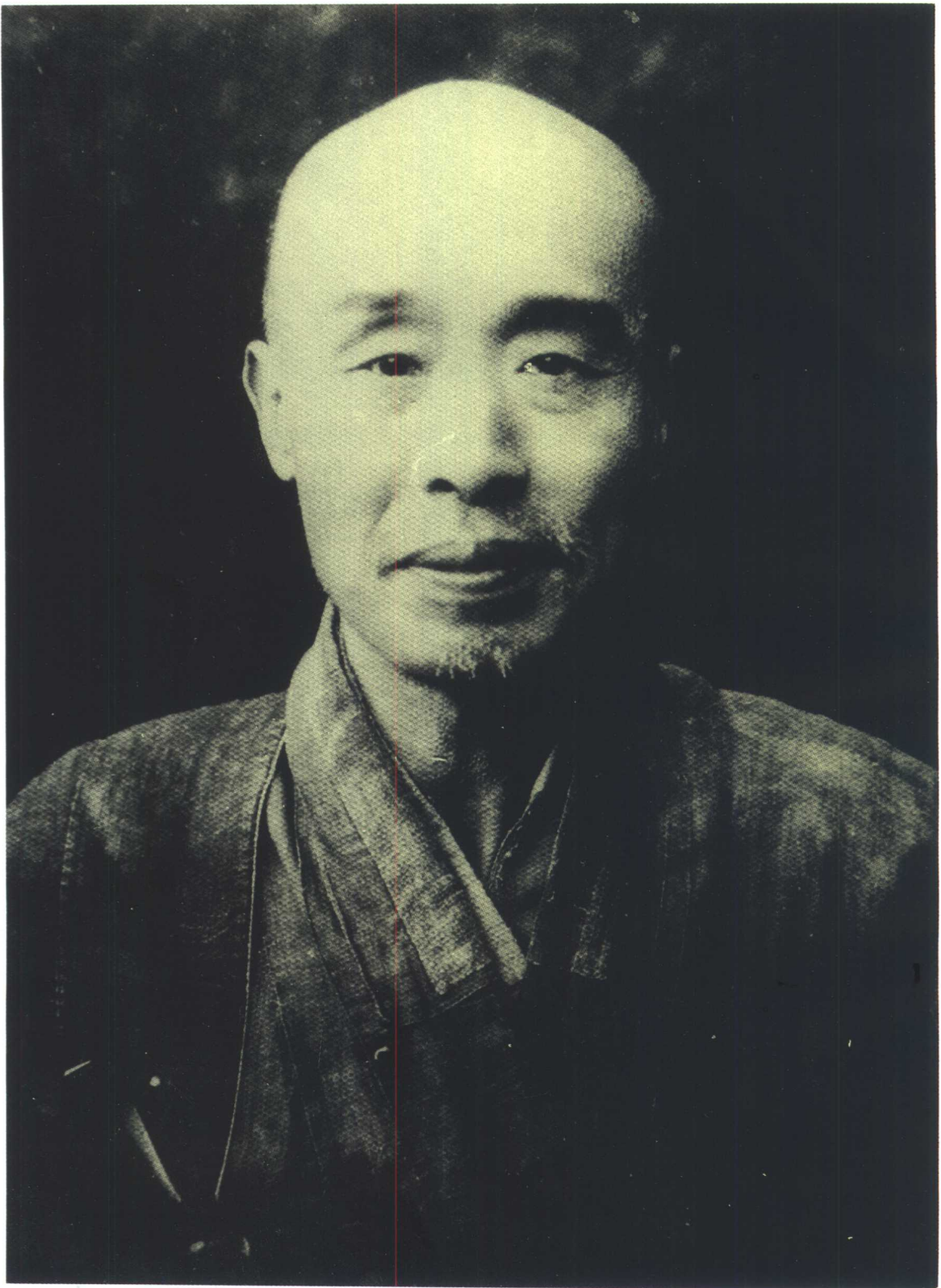
一九三五年攝於泉州