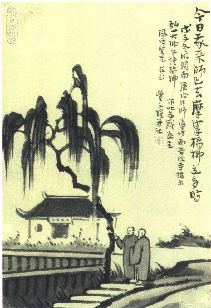
一九四六年豐子愷繪於廈門