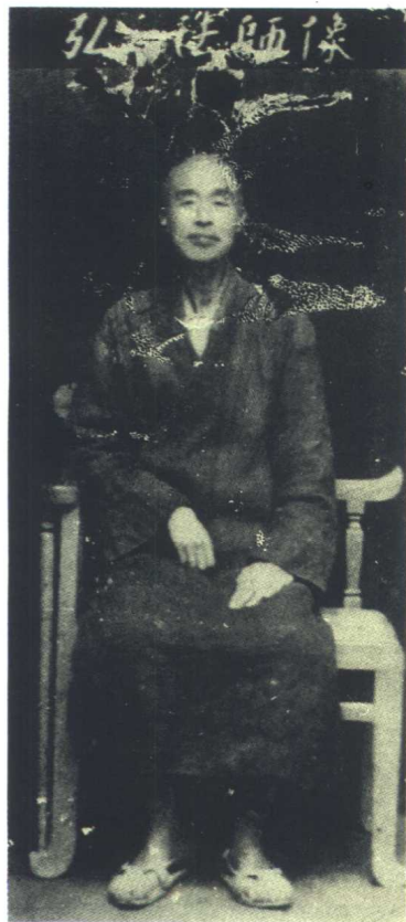
一九四二年攝於惠安