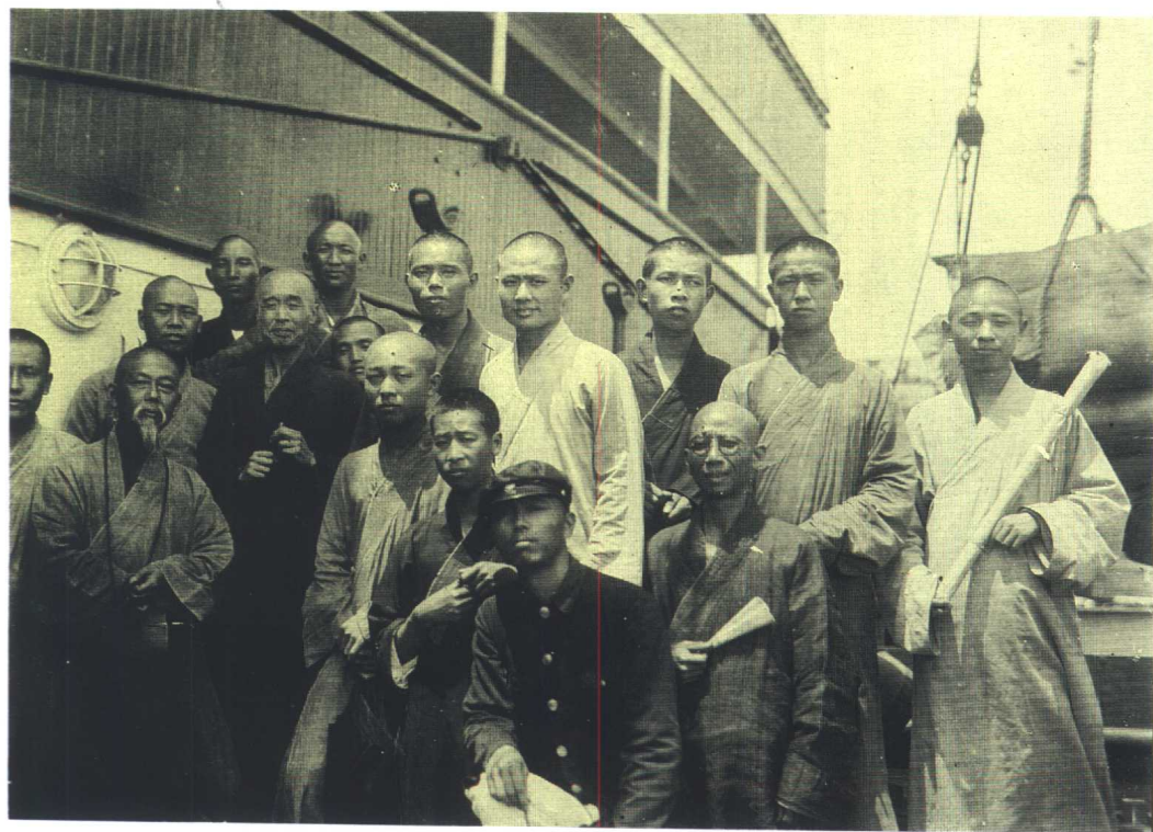
北上青島講律，出發前留影。一九三七年四月攝於廈門