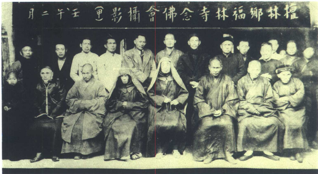
一九四二年攝於晉江福林寺