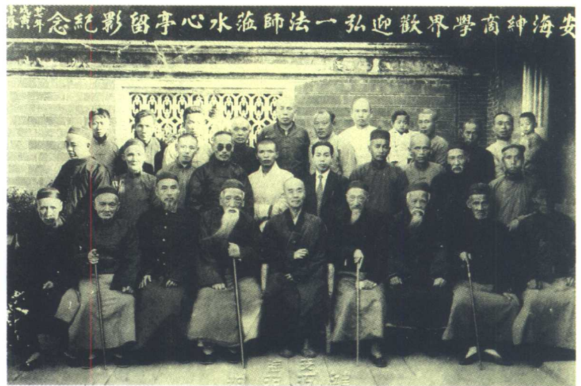
一九三八年攝於 晉江安海水心亭