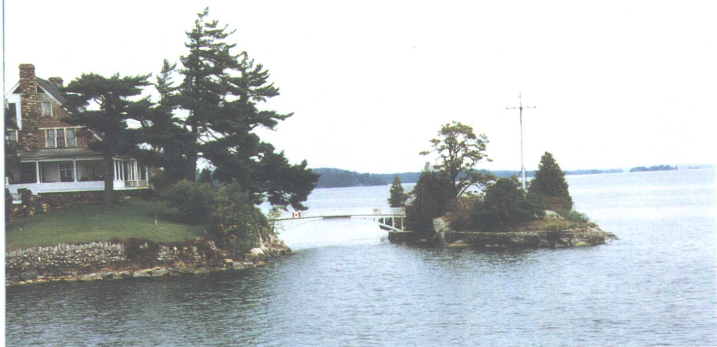
世界上最短的国际桥梁——“千岛湖”风景之一。桥中分界，左边是加拿大，右边是美国。