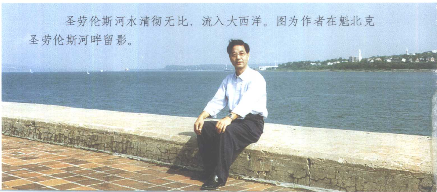
圣劳伦斯河水清彻无比，流入大西洋。图为作者在魁北克圣劳伦斯河畔留影。