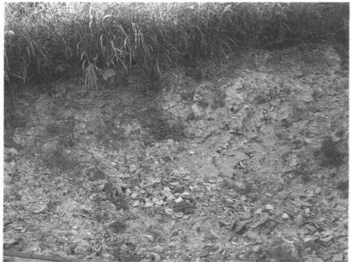
插圖 9 慶元縣上垵大窯窯址堆積層（上圖）