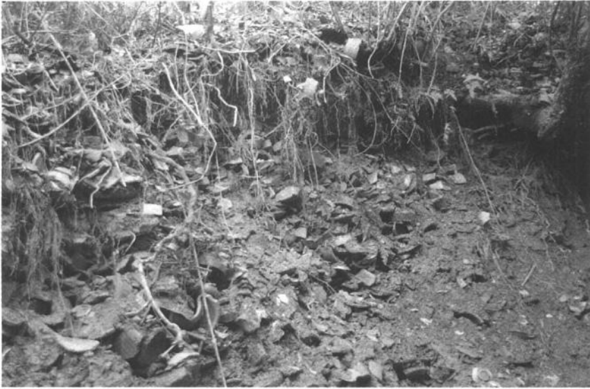
插圖 11 龍泉窯溪口瓦窯埕窯址堆積層

上，在碗的口部等距離地在釉上飾三塊半圓形褐彩；多角瓶上的褐斑飾在蓋和肩部兩旁，引人注目。印花，印在荷花碗的內底，中間為一頭坐牛，上有一朵雲，外圍一圈回紋。堆紋，堆貼在多角瓶的蓋和肩腹部，形似波浪。多角瓶在肩部裝羊角形的五角，「角」、「谷」音近，是一種內裝糧食的冥器。唐代多角瓶的出現為宋代龍泉窯多管瓶的生產，找到了淵源關係（圖 15-27）。