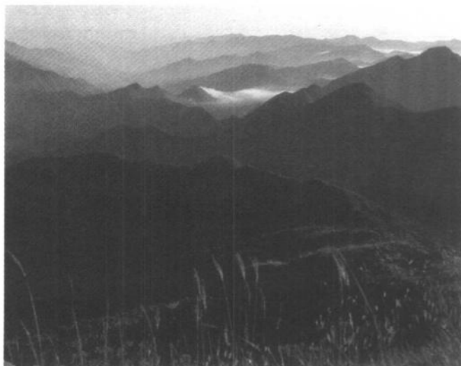
插圖 3 龍泉市鳳陽山