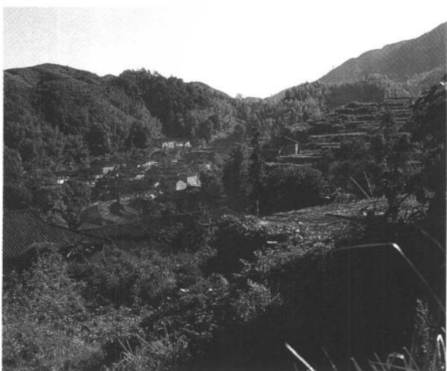
插圖 6 龍泉市大窯村