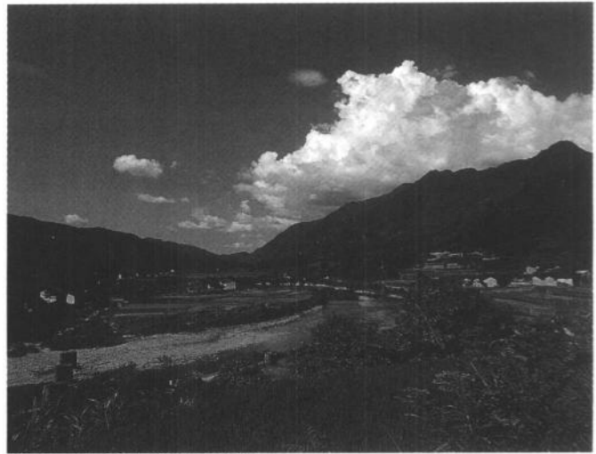
插圖 8 慶元縣上垟龍泉市金村