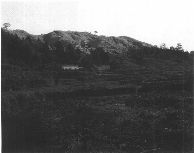
插圖 7 龍泉市大窯岙底