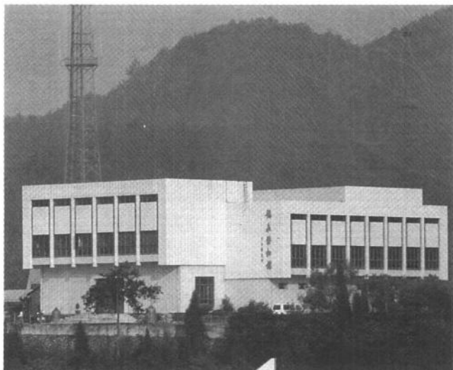
插圖 4 龍泉博物館