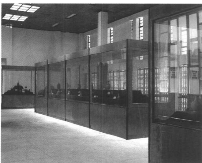
插圖 5 龍泉博物館展廳

以將分布在麗水、溫州地區這一類型的瓷窯定名為「龍泉窯」是非常合理的（插圖 2-14）。明成化二年（公元 1466 年）進士，後在浙江參政的陸容，在他所著的《菽園雜記》中說「青瓷初出於劉田（通稱‘琉田’，即今‘大窯’），去縣六十里，次則有金村窯，與劉田相去五里餘，外則白雁、梧桐、安仁、安福、綠逸等處皆有之。然泥油精細，模範端巧，俱不若劉田……。」[2]文中提到龍泉其他地區的瓷窯在胎釉的精細，成型的端巧都不如劉田，與事實相符。