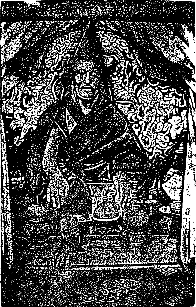
尼德爾額禪班師大慈廣化宜國護