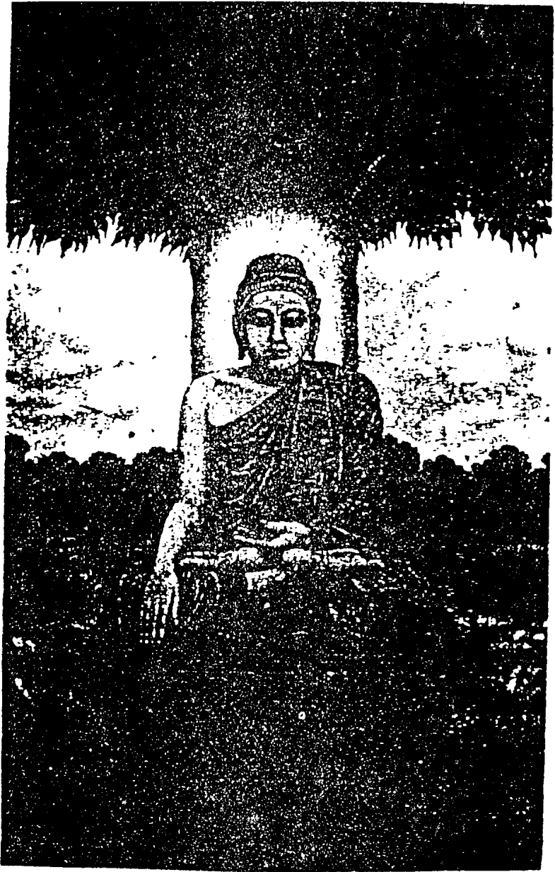
佛 尼 牟 迦 釋