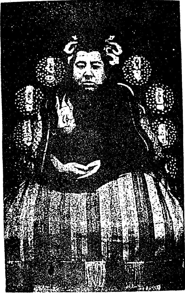
持綜化開因昭明光濟宏慈廣善普頂滋 國克國呼嘉章師國大教輔覺淨教黃