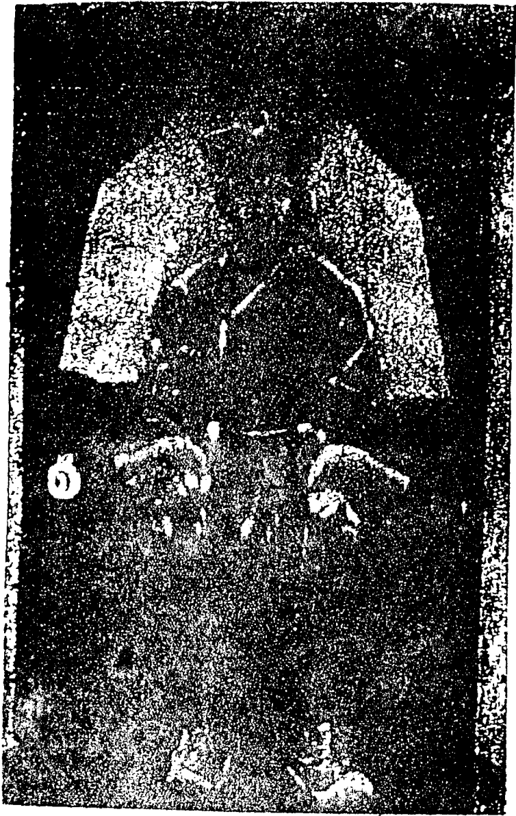
外蒙善輔化博多克哲布丹呼圖克圖