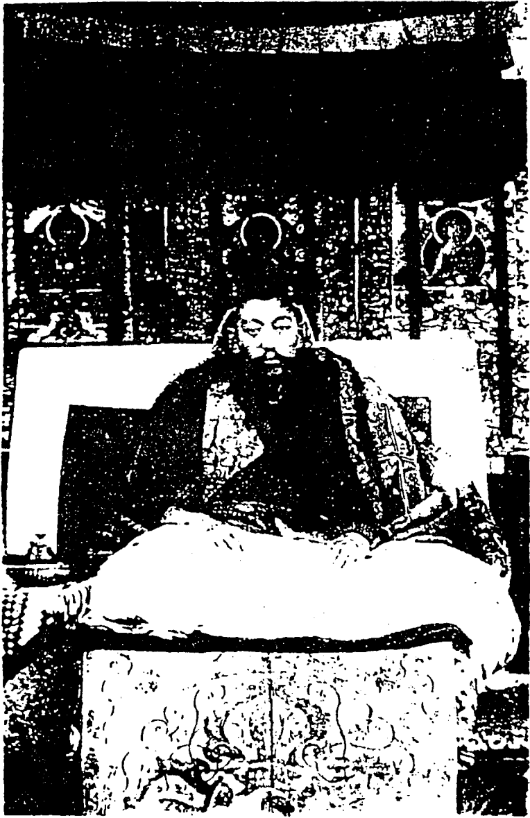
護國宏化普慈圓覺大師達賴喇嘛