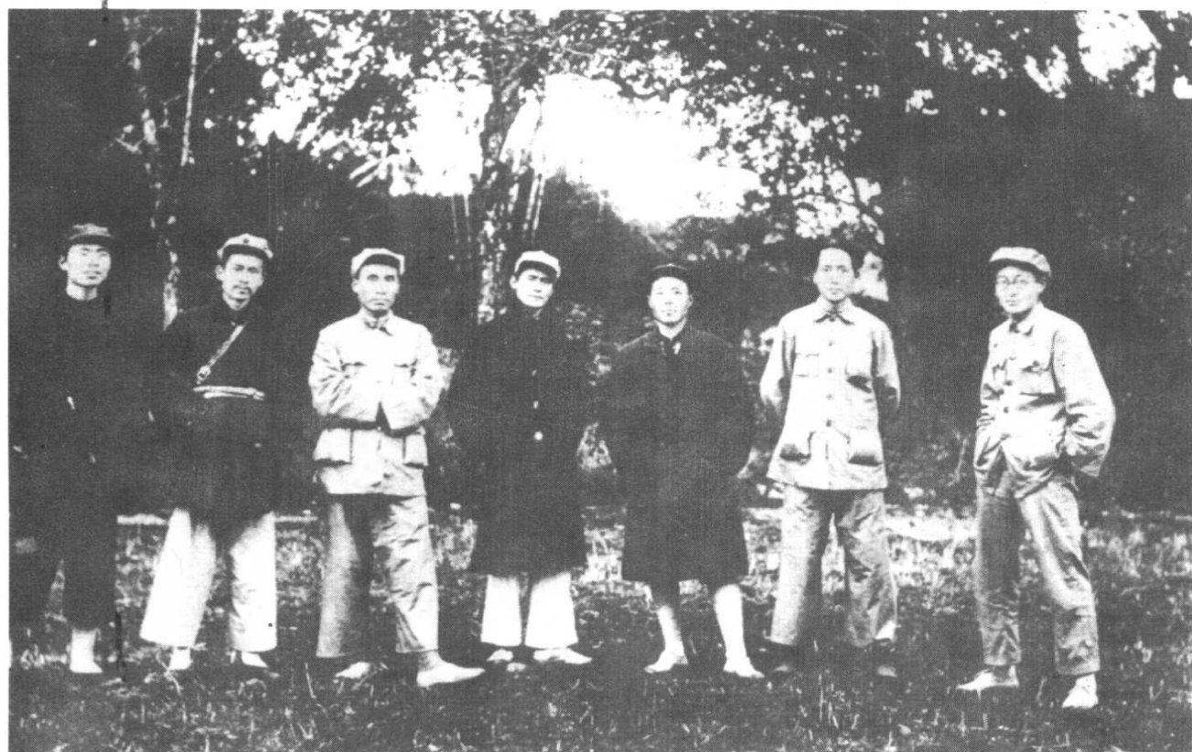
1931年11月中央局委员合影。右起：王稼祥、毛泽东、项英、邓发、朱德、任弼时、顾作霖。