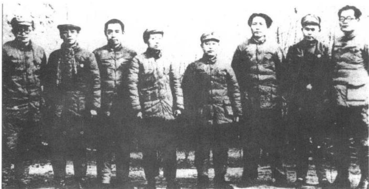
1938年4月，张国焘逃离延安，声明脱党。中共将其开除党籍 图为张国焘(右一)与(左起)张闻天、康生、周恩来、凯丰、王明、毛泽东、任弼时在延安时的合影