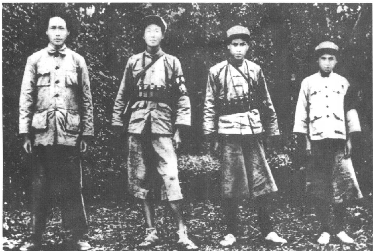
1931年毛泽东同警卫员在瑞金合影。左起：毛泽东、吴光荣、陈昌奉、戴田福。