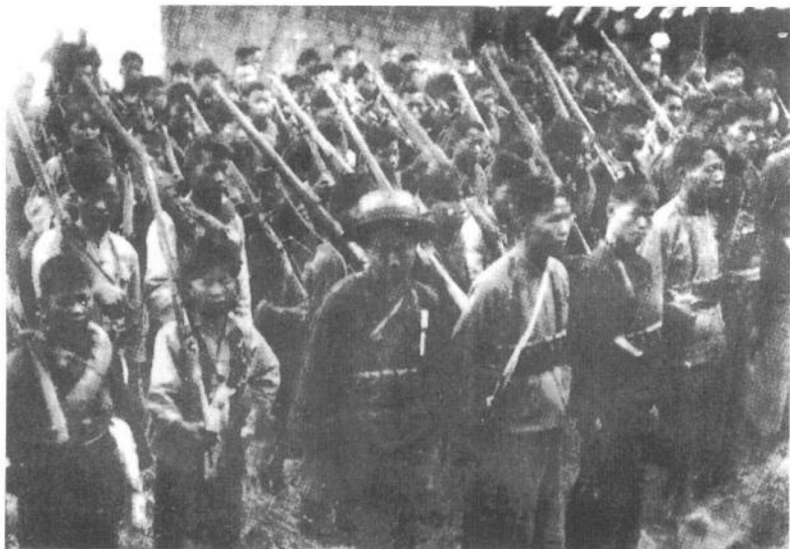
1927年10月中共在各地组织武装暴动