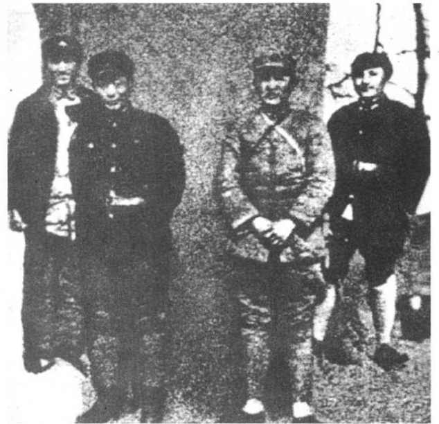
长征到达陕北的红军将领的一部分。右起：邓小平、徐海东、聂荣臻、程子华