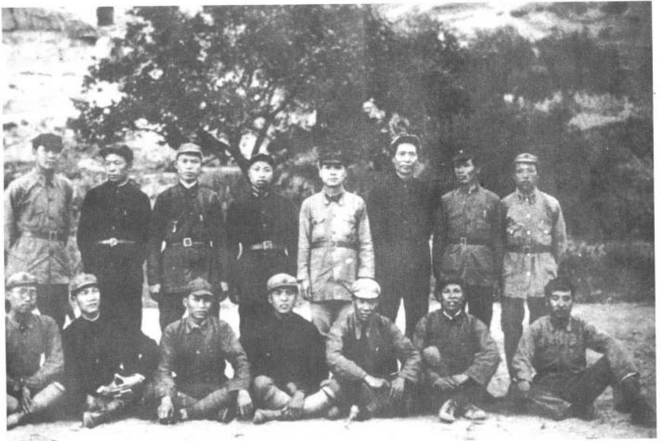
图为毛泽东与创建井冈山革命根据地的部分干部在延安合影。前排左起：罗荣桓、张文彬、陈光、杨立三、陈士榘、宋裕和、林彪。后排左一赵尔陆、左六毛泽东、左八谢今古。