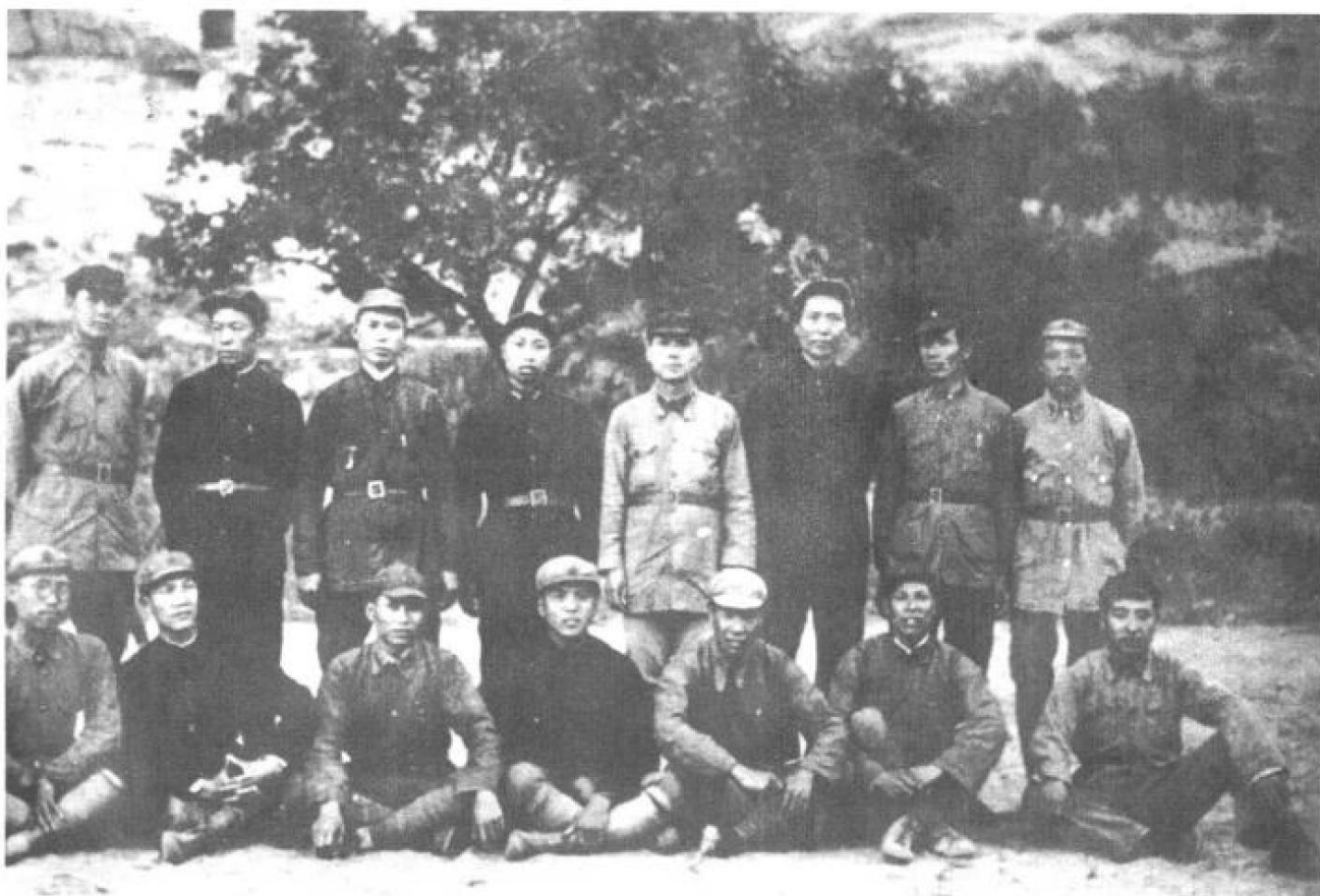
图为毛泽东与创建井冈山革命根据地的部分干部在延安合影。前排左起：罗荣桓、张文彬、陈光、杨立三、陈士榘、宋裕和、林彪。后排左一赵尔陆、左六毛泽东、左八谢今古。