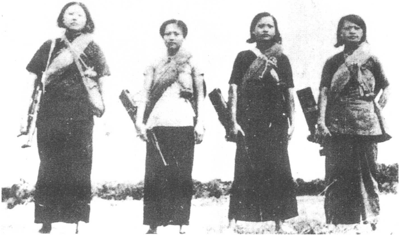
1932年8月琼崖红色根据地的女战士