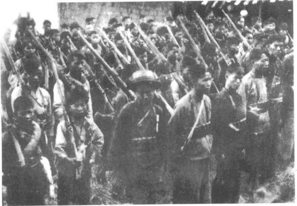
1927年10月中共在各地组织武装暴动