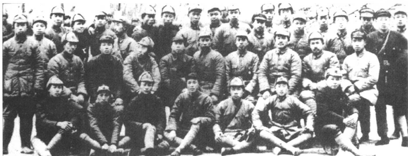
1936年10月，红二方面军到达陕北后部分人员合影。第二排右二为任弼时，右三为贺龙