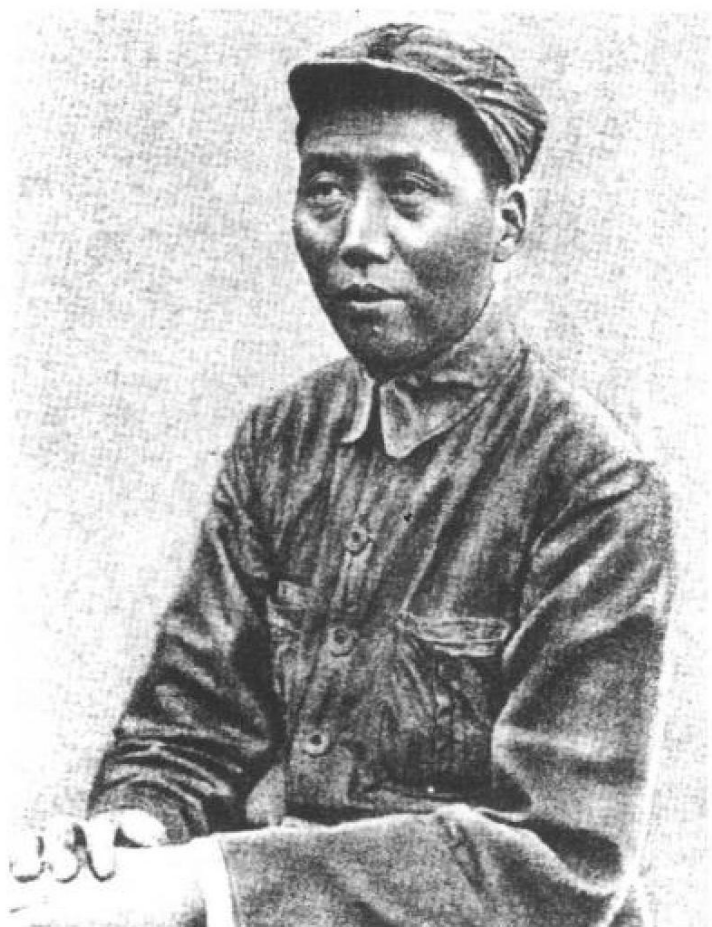
1937年5月，中共中央军委主席毛泽东在延安