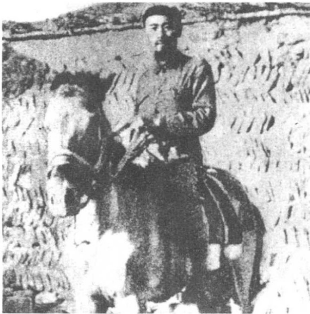
长征到达陕北的周恩来