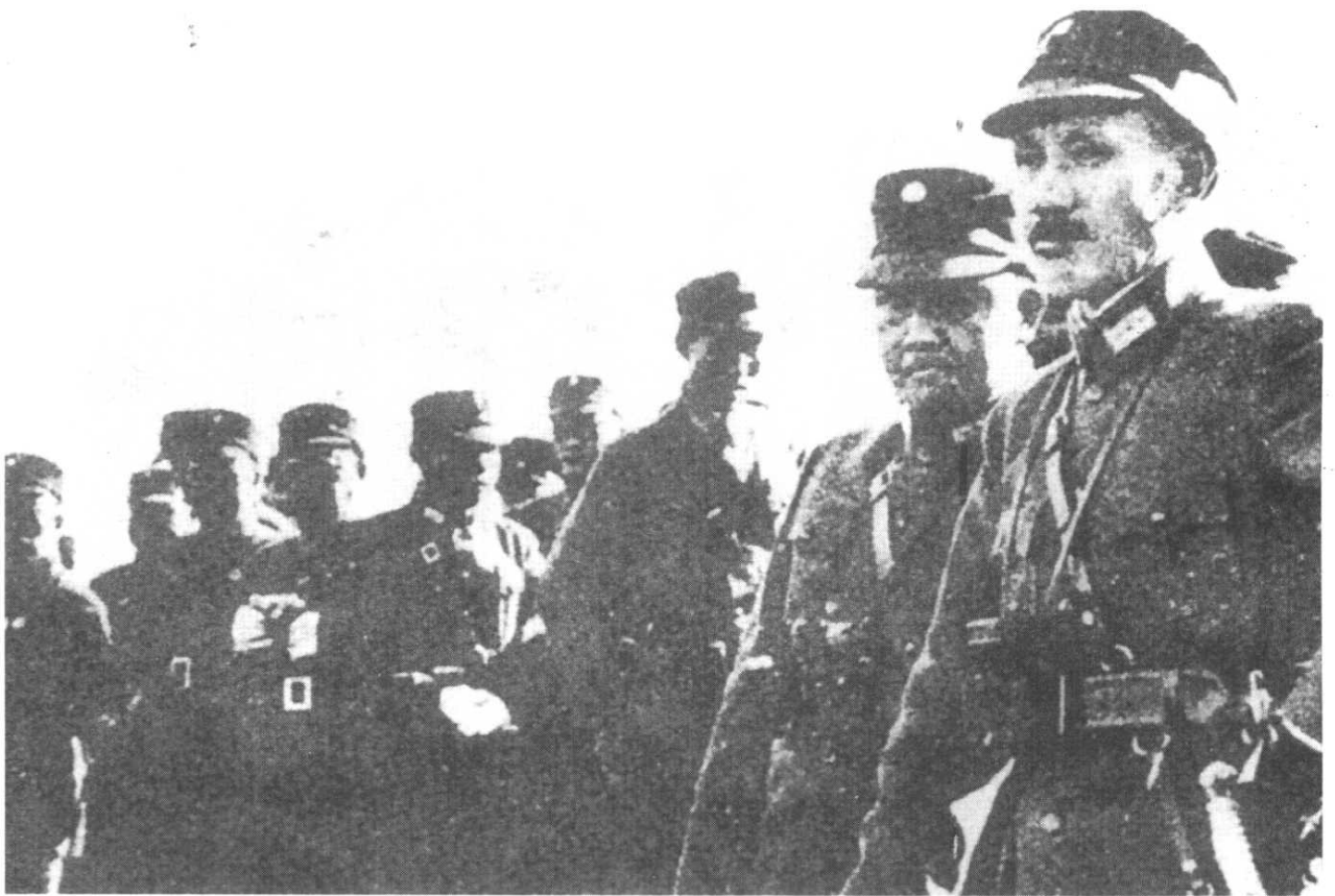
1931年6月，蒋介石率大批军事人员抵达南昌，部署第三次“围剿”。