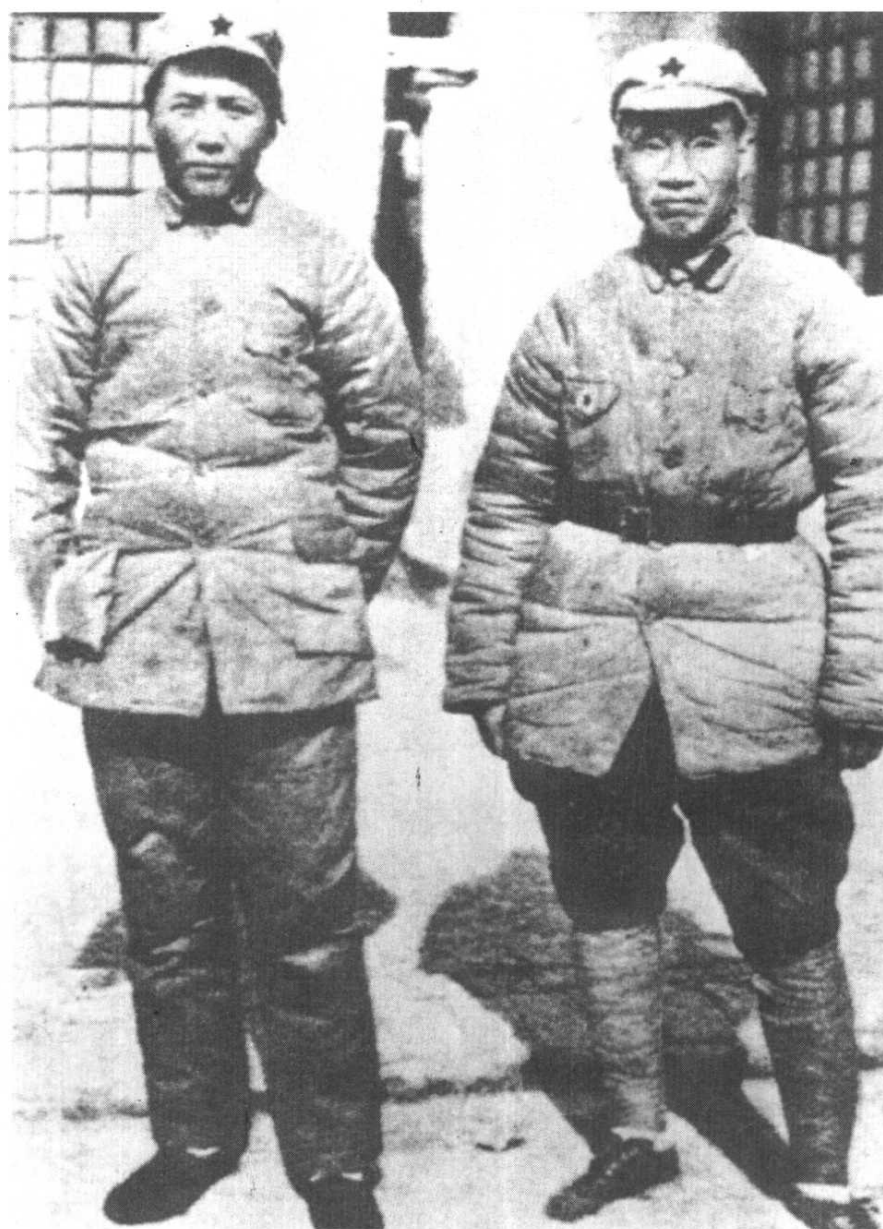
1936年11月朱德与毛泽东在陕北保安合影