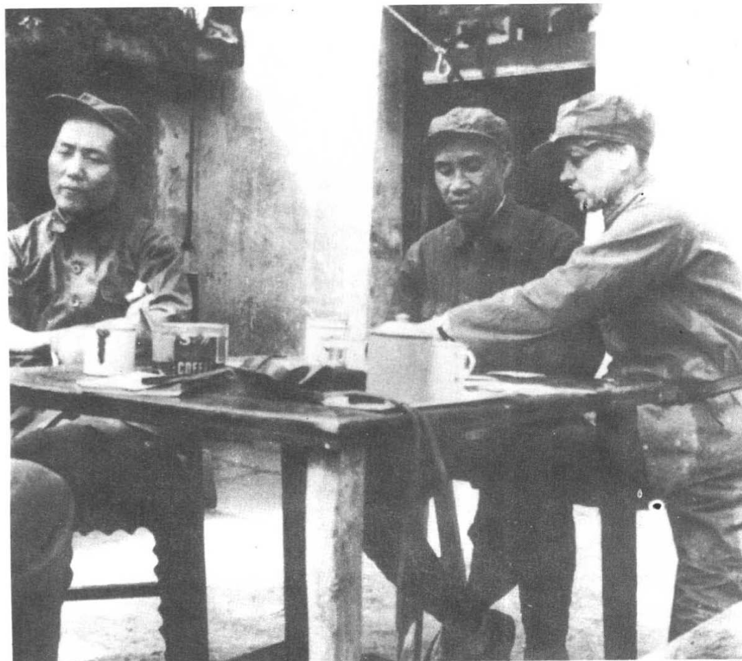
1937年初，毛泽东、朱德与史特莱在延安。