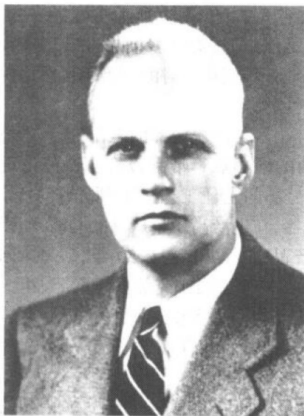
奥尔顿·爱德华·贝雷

奥尔顿·爱德华·贝雷 1907 年出生于美国得克萨斯州的中部,四十六年后逝世于田纳西州的孟菲斯。在其短暂的职业生涯中,贝雷在油脂科学技术上留下了无人比拟的足迹。在其众多成就中,传世之作——《贝雷:油脂化学与工艺学》无疑是最重要的。该书于 1945 年首次出版后,立即成为油脂工业的金科玉律,时至今日依然如此。为了纳入更新的科学发现和工程发展,在他去世后,该书也历经数次更新与增补。然而在详细阅读此书 1945 年第一版时,读者几