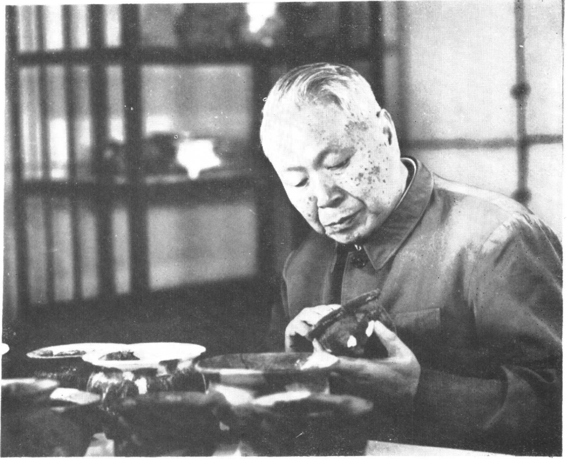
1983年11月作者在北京琉璃河观摩陶鬲