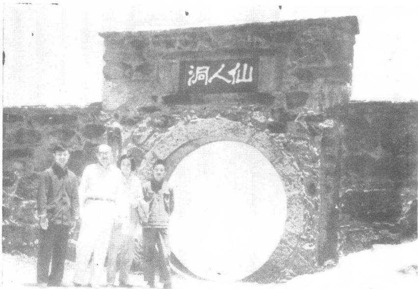
张闻天同志 1959 年在庐山仙人洞与周围同志合影