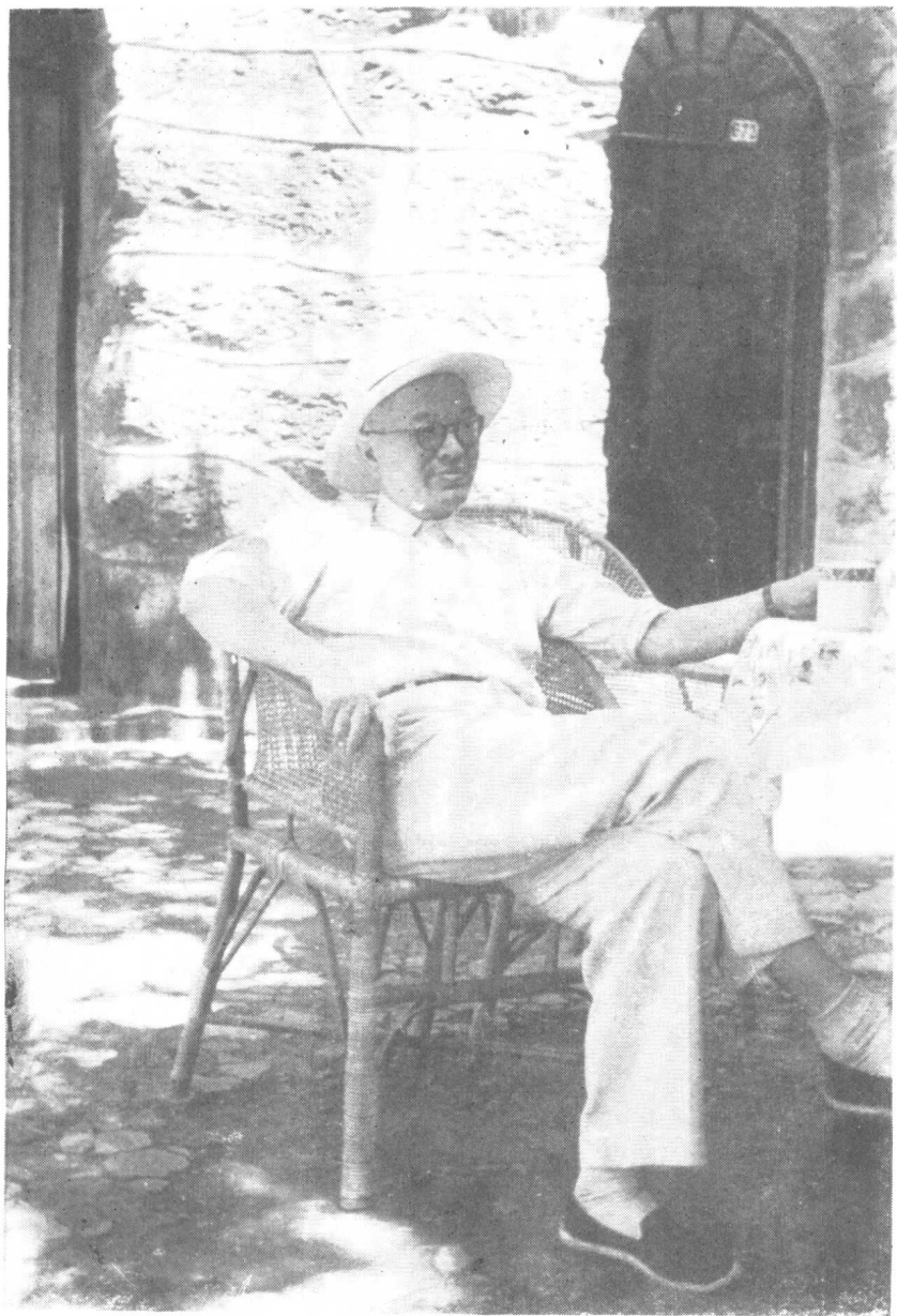
张闻天同志 1959 年在庐山