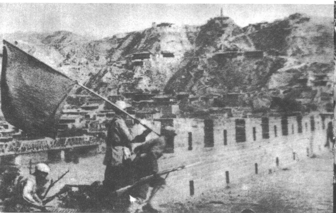
△ 某部十九团三营把胜利的红旗插上兰州城头。