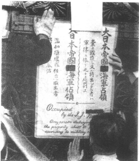
太平洋战争爆发后，日军 占领在上海的英国麦加银行

细检讨因日本对英美突击所引起之局势。会议中对中国于华府谈话仍在进行之际，突发狡诈之攻击，深表愤慨及惊异。中国对于此等狡诈及国际强盗行为，自堪憎恶。日本攻击之一特点，可予注意，即该项攻击，系于星期日发动者，与其轴心伙伴惯于周末发动侵略行动，如出一辙。蒋委员长已于今日下午分交英美苏三大使以电文，请其转达罗斯福总统，丘吉尔首相及斯大林委员长。另由余接见澳公使艾格斯顿爵士，面交电文一件，请其转达寇丁首相。各电现正在途中。故余不能在其到达前公布其