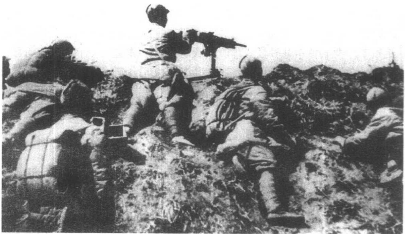
八路军向敌人射击