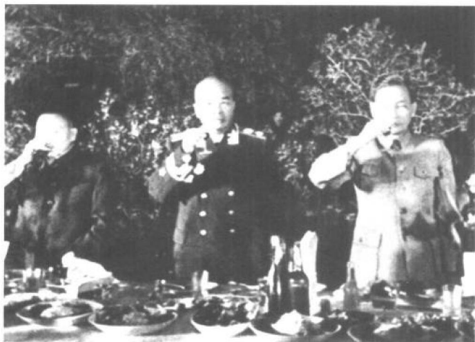
◀1955年9月27日，在庆祝授衔、授勋的酒会上，彭德怀元帅与邓小平、陈云举杯祝酒