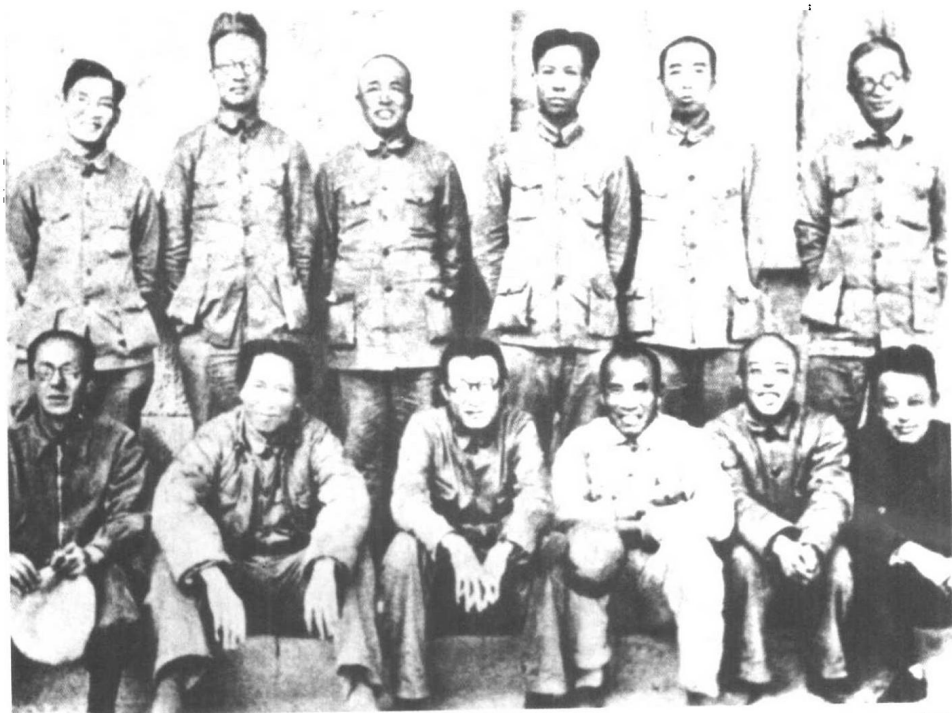
▲1938年，彭德怀与参加党的六届六中全会的部分领导人合影。前排左起：康生、毛泽东、王稼祥、朱德、项英、王明。后排左起：陈云、秦邦宪、彭德怀、刘少奇、周恩来、张闻天。