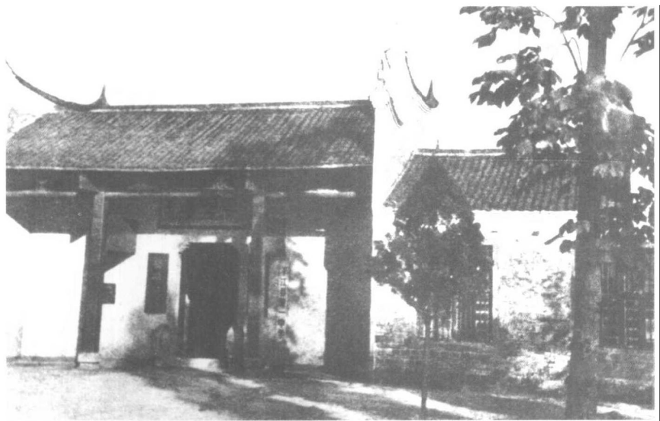
▲1928年7月,彭德怀与滕代远等发动和领导了著名的平江起义。图为起义旧址方岳书院。