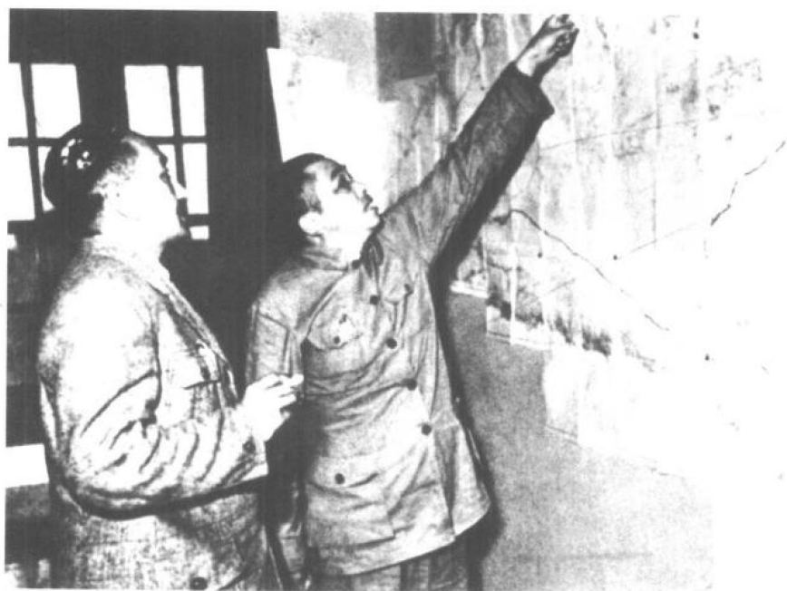
◀1949年9月,彭德怀在兰州与新疆维吾尔族代表艾买提研究进军新疆。