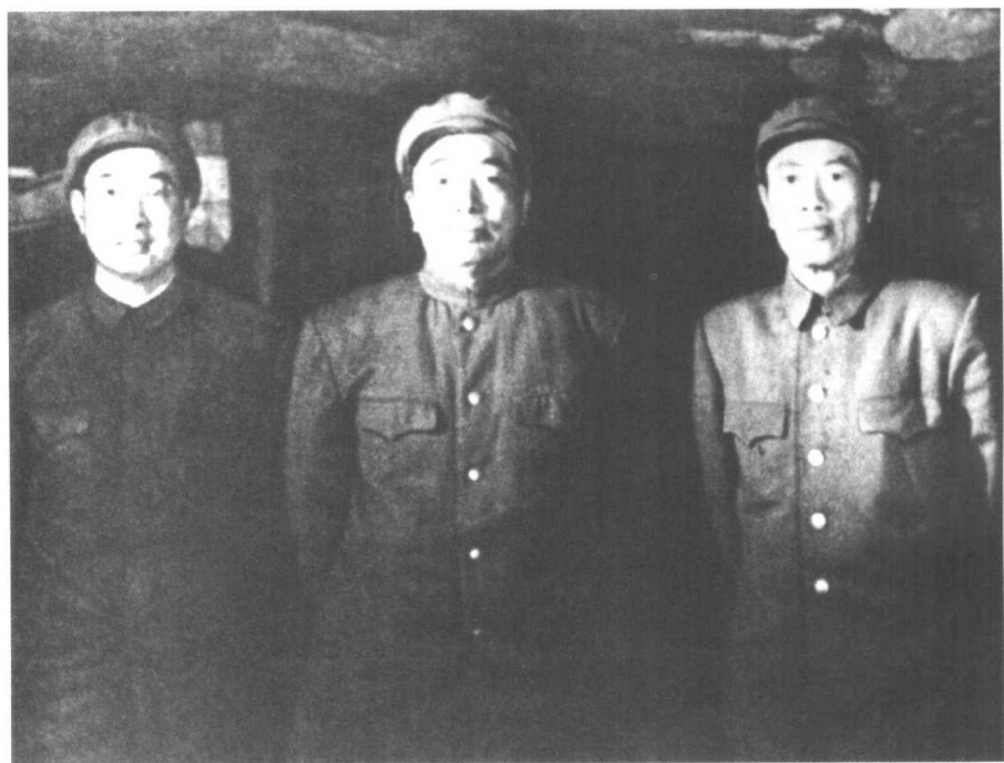
▼ 1952年春,志愿军司令员彭德怀与副司令员陈赓(左)、邓华(右)在一起