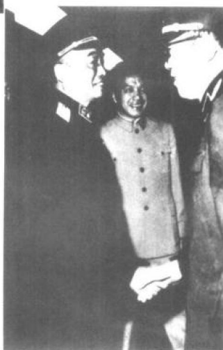
▶1959年6月13日，国防部长彭德怀元帅访问欧洲7国和蒙古人民共和国回到北京后在车站受到总参谋长黄克诚大将的迎接和欢迎。