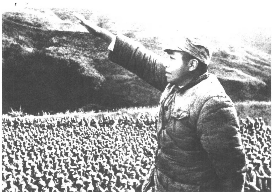
▲1947年3月,彭德怀司令员在延安保卫边区动员大会上讲话