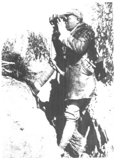
◀1940年，彭德怀副总司令在“百团大战”前线视察敌情。