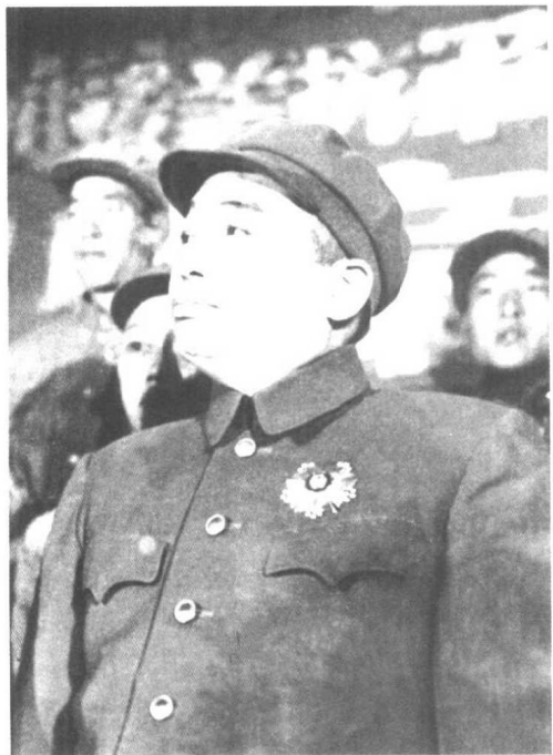
◀ 1951年10月,中国人民志愿军赴朝作战一周年时,朝鲜民主主义人民共和国授予彭德怀司令员一级国旗勋章