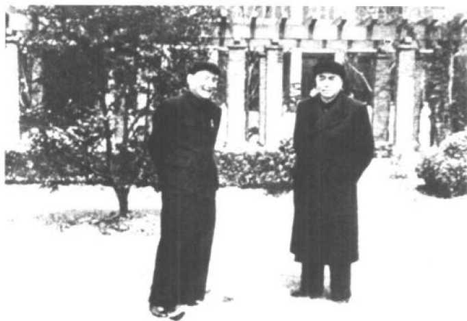
◀1959年春，在中共中央举行的上海会议期间，彭德怀与陈云合影