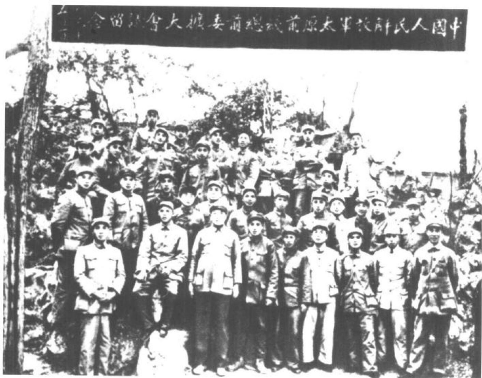
▲1949年5月,彭德怀与出席太原前线总前委扩大会议的同志合影。