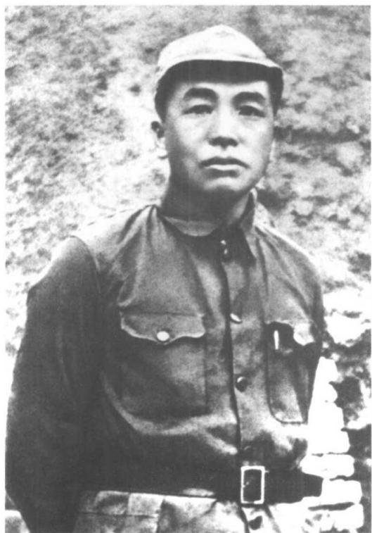
◀长征到达陕北后的彭德怀