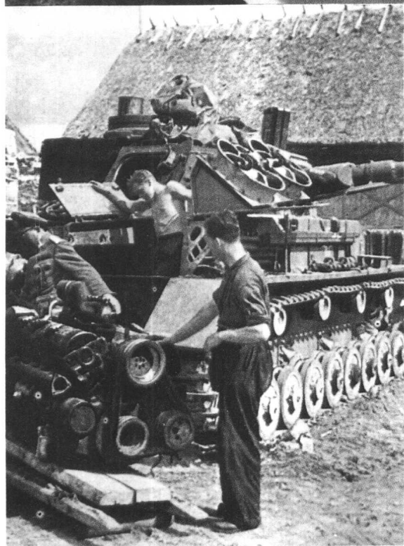
德国机械员正在 修理陷在苏联农村土 路泥泞中的坦克