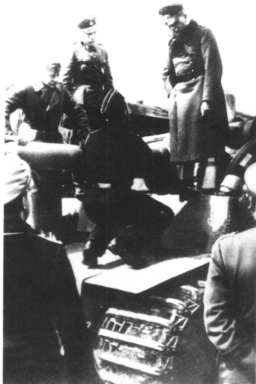
古德里安在视察坦克