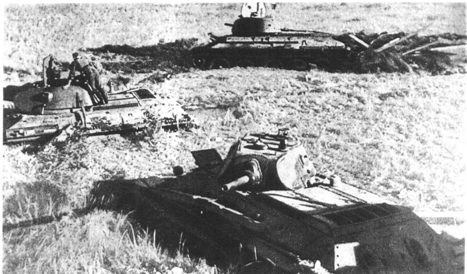
德国装甲兵在仔细观察被苏军丢弃的 T—34 型坦克