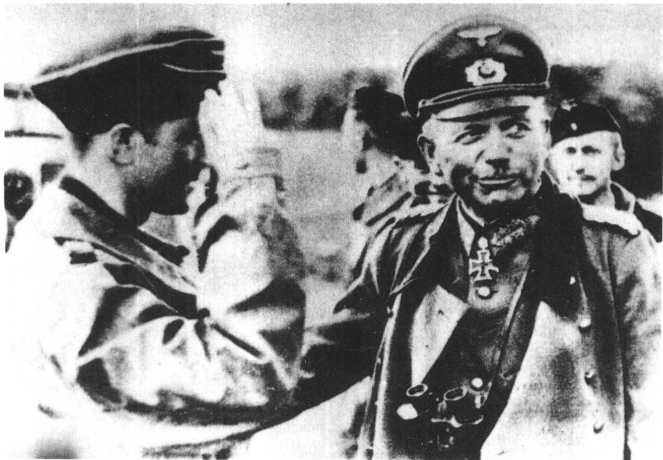
春风得意的古德里安