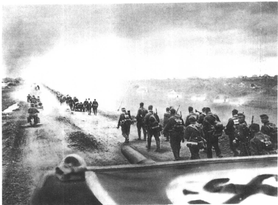
德军步兵后面的 装甲车上铺着“卐” 字旗