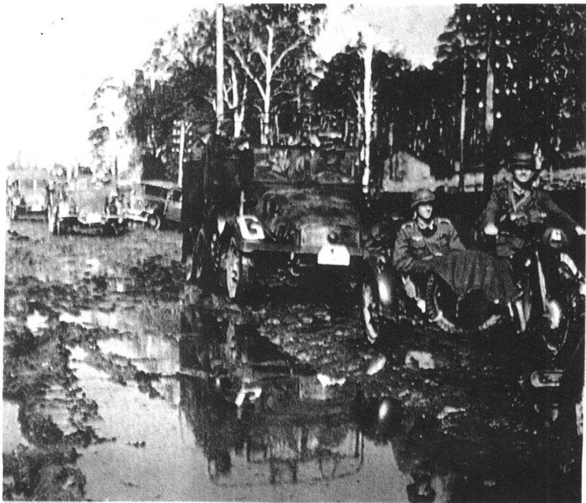
德国摩托化部队在苏联泥泞的道路上艰难地行进