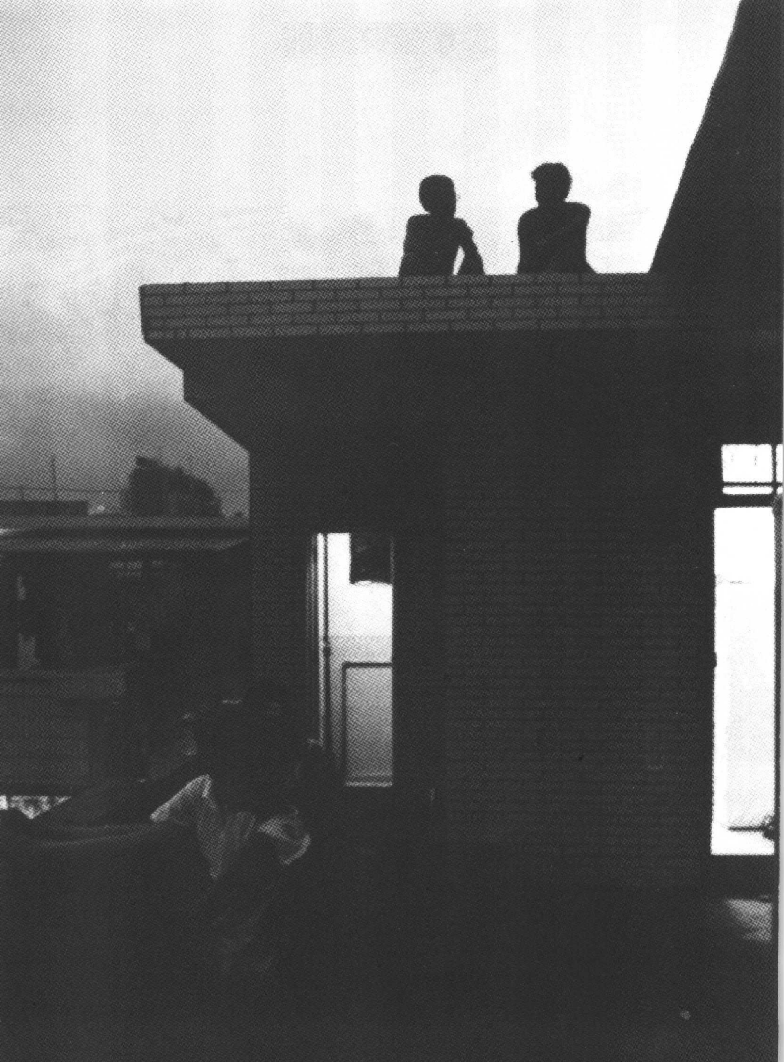
姑娘们准备上班,小伙子们在房顶上纳凉