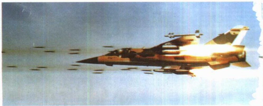
法国空军幻影 F-1 战斗机在发射火箭。