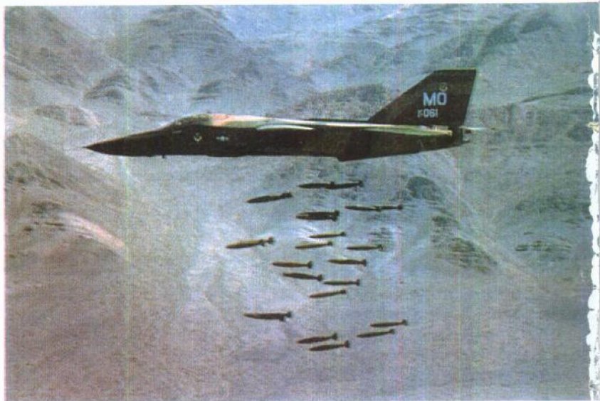
美国空军F-111战斗轰炸机向地面目标投弹。