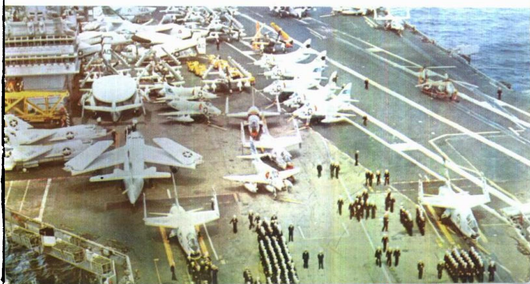
美国海军超级舰空母舰“萨拉托加”号。