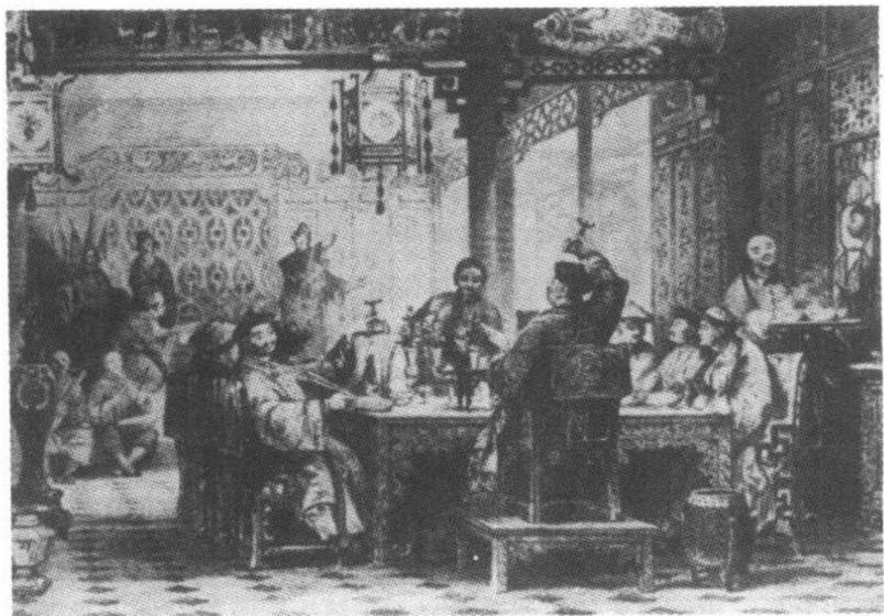
陶醉于灯红酒绿中的贵族(画照)

英国是当时最强大的资本主义国家。它较早地进行了资产阶级革命和产业革命,许多先进的科学发明都产生在这个国家。特别是瓦特蒸汽机的发明并运用到其它工业生产,使机器工业很快占据了主导地位,从而大大增强了国家的实力。为此,英国成为头号侵略国家,其侵略矛头首先指向落后的中国。