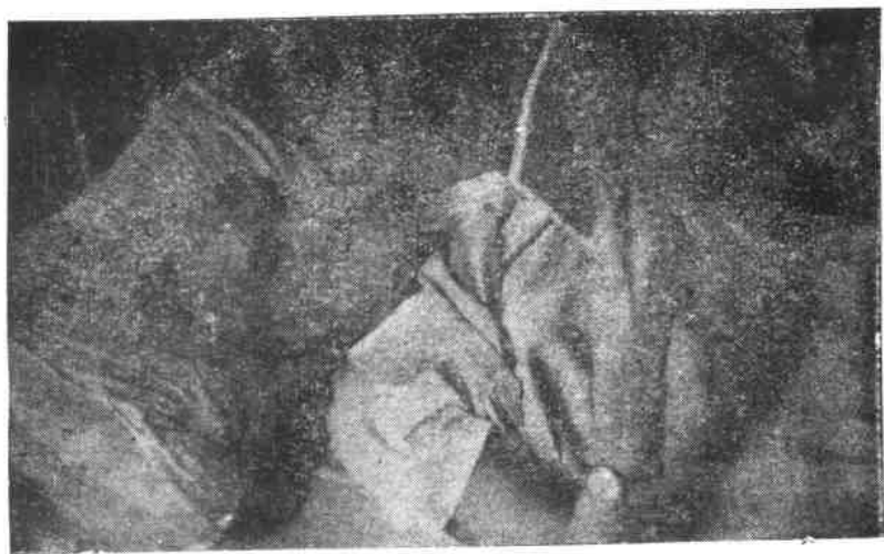
1972年6月曹聚仁在澳门镜湖医院卧病写作