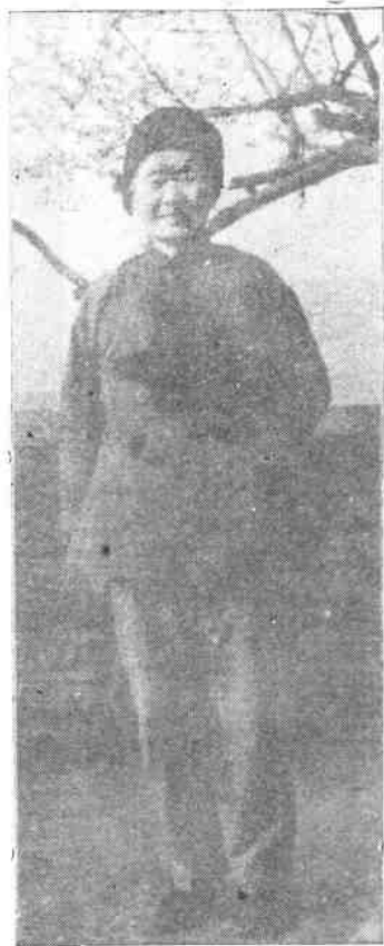
1981年王春翠摄于兰溪县蒋畈 寓次