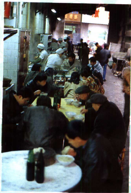
武汉大街小巷遍布小吃摊,方便了市民。