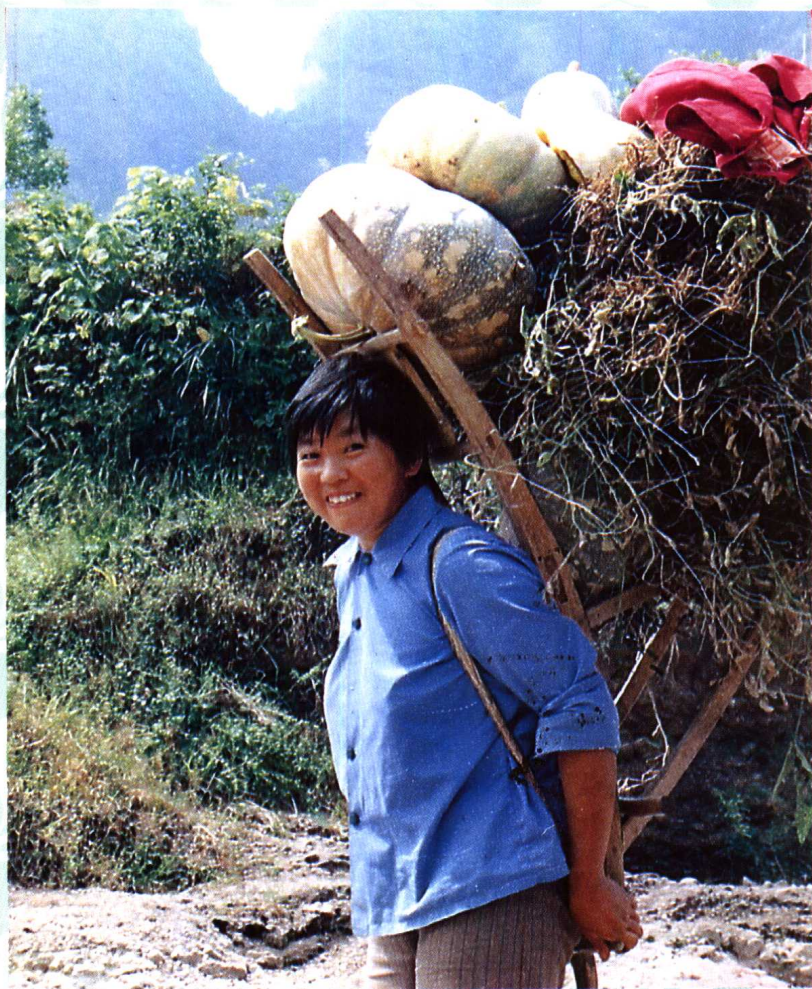
吃苦耐劳的土家姑娘