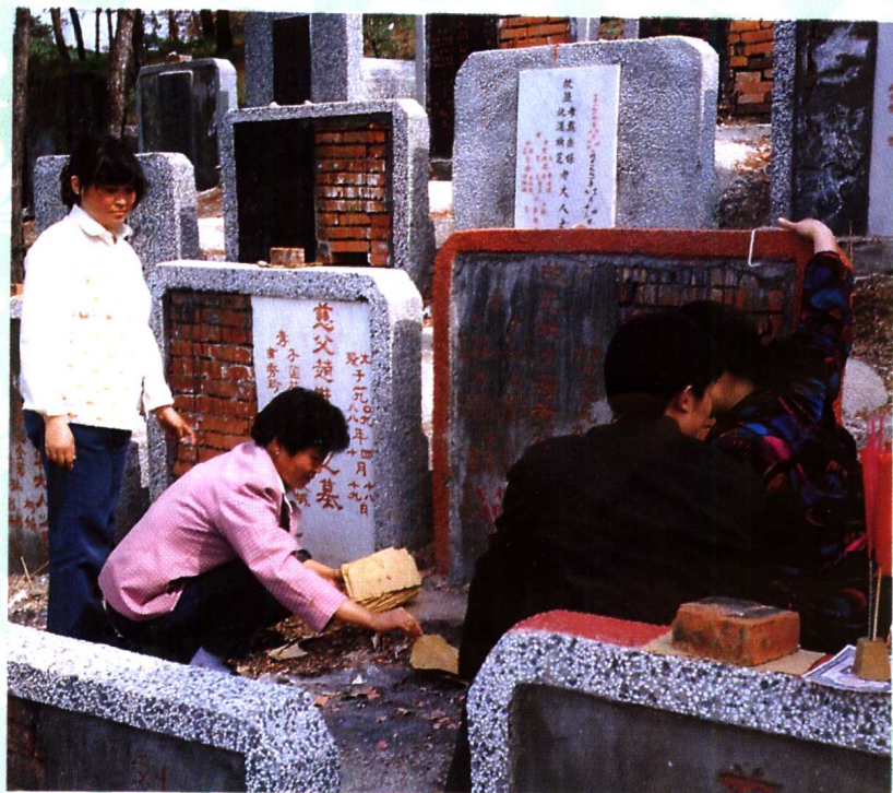
武汉清明节人们的祭习俗