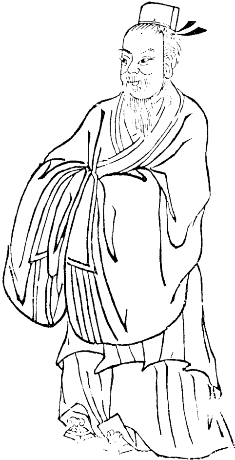
梁溪榮氏家族遠世第一祖，系孔子七十二弟子之一。