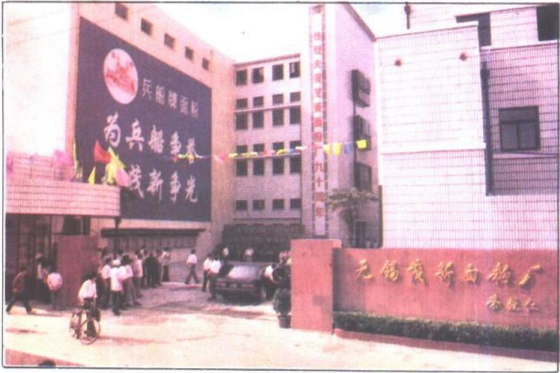
榮宗敬、榮德生兄弟在無錫最早創辦的企業，茂新第一面粉廠。