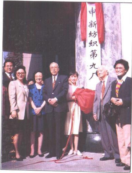
上：這是恢復申新紡織第九廠時所攝的照片。自右至左是：上海統戰部副部長茅志瓊、上海市前副市長張承宗、榮鴻慶、榮卓如（喬治·哈同夫人，榮鴻慶的姐姐）。