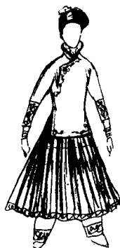
叶锦添服装造型设计草图