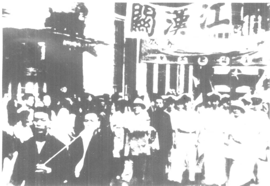
4、江汉关职工上街游行，欢庆武汉解放。