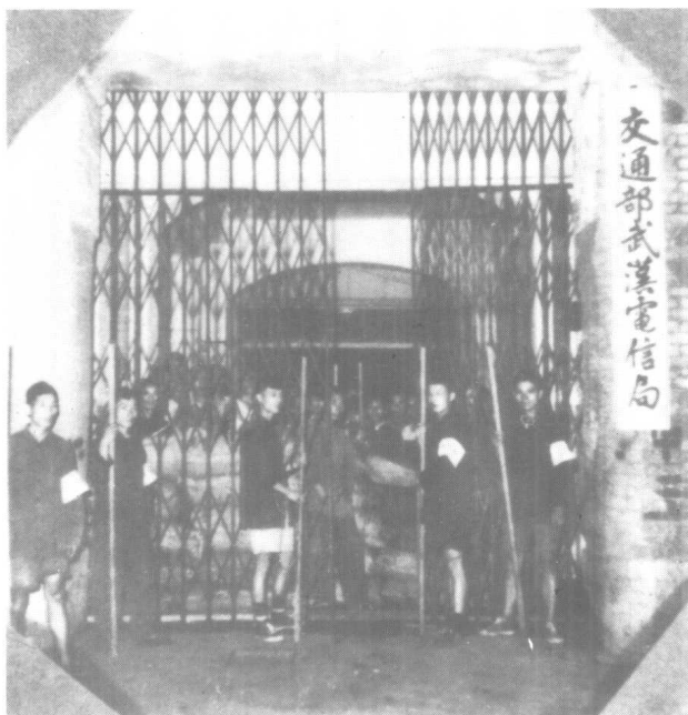
3、武汉电信局工人组织纠察队护厂，阻止敌人破坏电信设施，迎接人民解放军的到来。