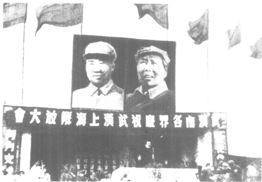
2、武汉各界庆祝沪汉解放大会会场。台上讲话者为武汉市首任市长吴德峰。