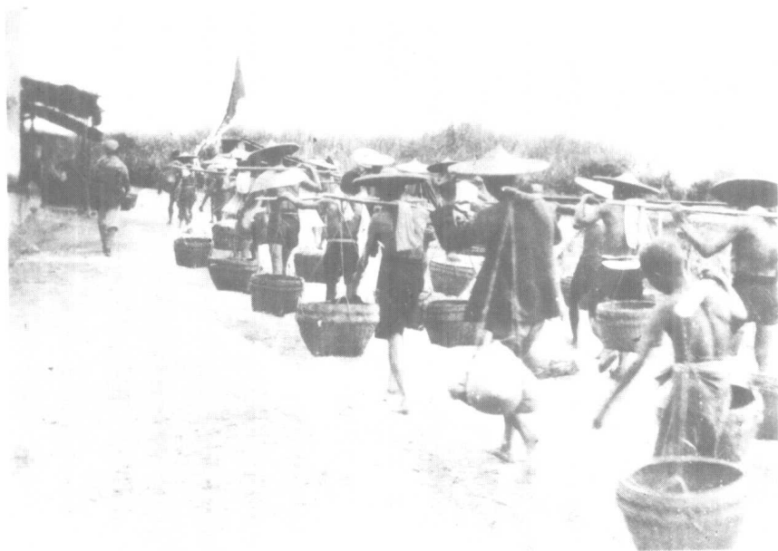
6、我军解放中南，群众运送公粮。