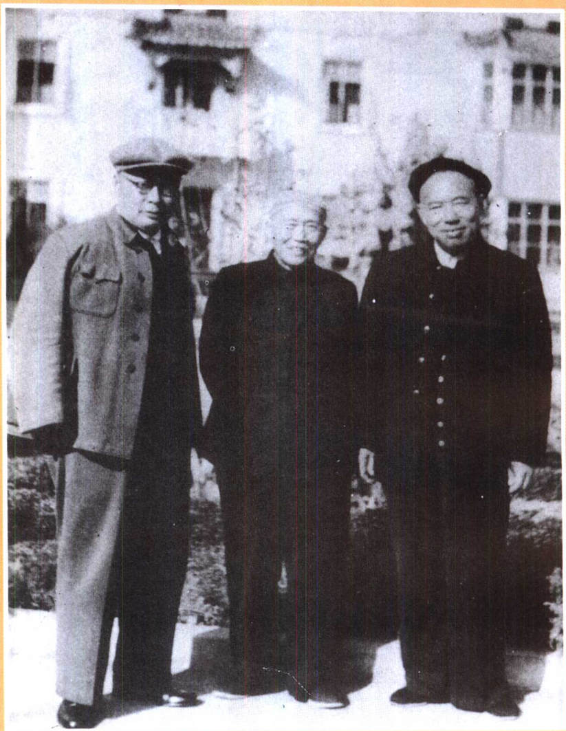
徐特立与陈毅(左)、李卓然(右)在北京合影。