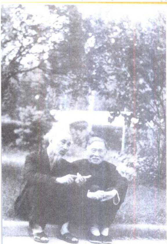
一九五八年徐特立与越南胡志明主席亲切交谈