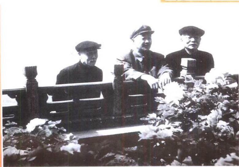
一九五五年徐特立与贺龙(中)、林伯渠(右)在中南海。