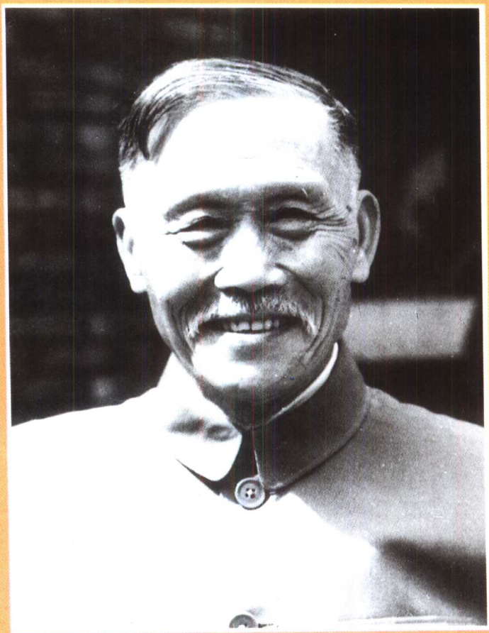
八十高龄的徐特立