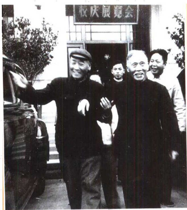
一九五九年十月徐特立参观北京工业学院校庆展览会。