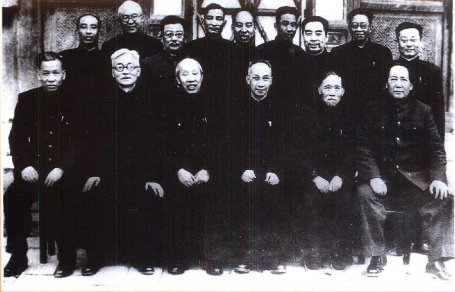
一九四九年九月第一届中国人民政治协商会议期间，徐特立（前排右二）与毛泽东、吴玉章、董必武、林伯渠、刘少奇、陆定一、周恩来、彭真、陈云等合影。