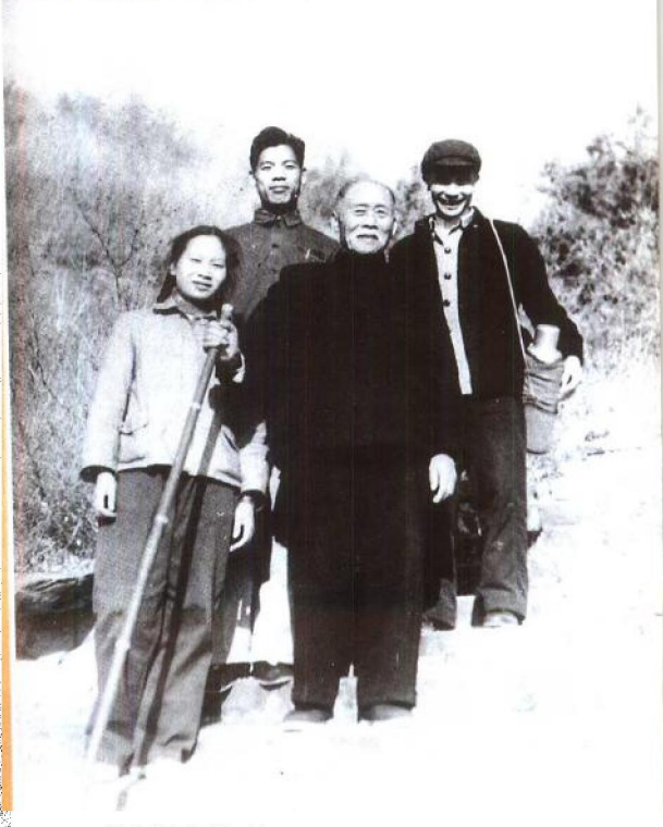
一九五九年徐特立游香山。从人背的暖水瓶仍是一九四七年从延安转移时，毛泽东送给徐老的那只热水瓶。