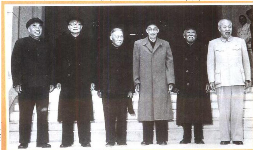
徐特立（左三）與朱德、林伯渠、吳玉章、謝覺哉、董必武於一九五四年四月在中央檔案館開館時合影。