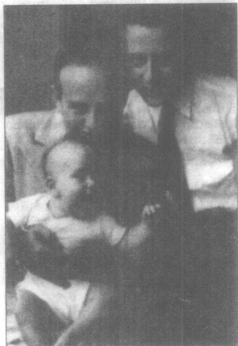
本、小牛顿和小本·格雷厄姆。