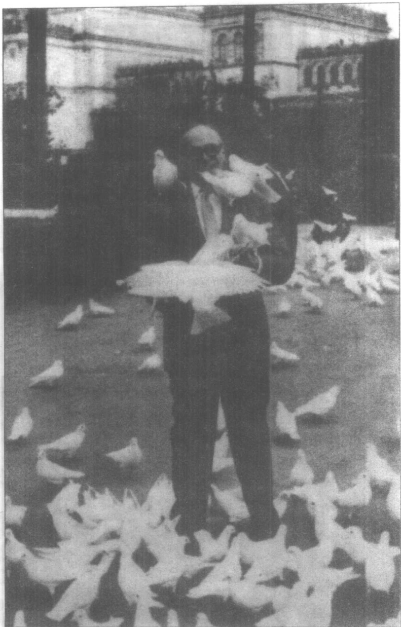
本杰明·格雷厄姆，1964年摄于西班牙塞维拉。鸽子蜂拥而至，如同他的学生和客户们一样！