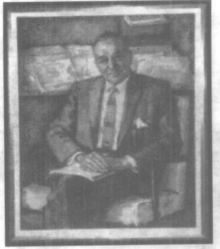
本杰明·格雷厄姆肖像画，沃伦·巴菲特礼物。