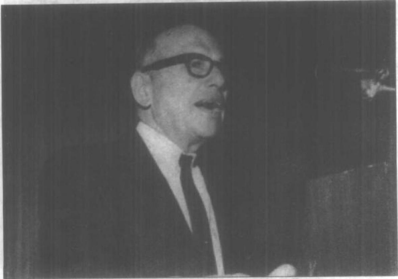
本杰明·格雷厄姆在金融分析师大会上演讲，1965年1月19日。