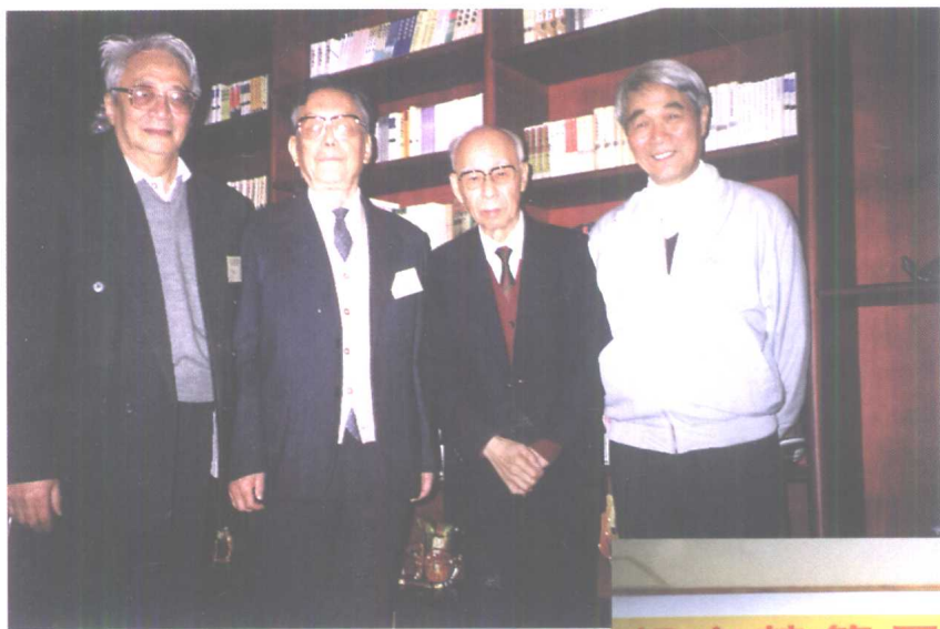
萧萐父、任继愈、饶宗颐、庞朴（从左至右）四先生合影