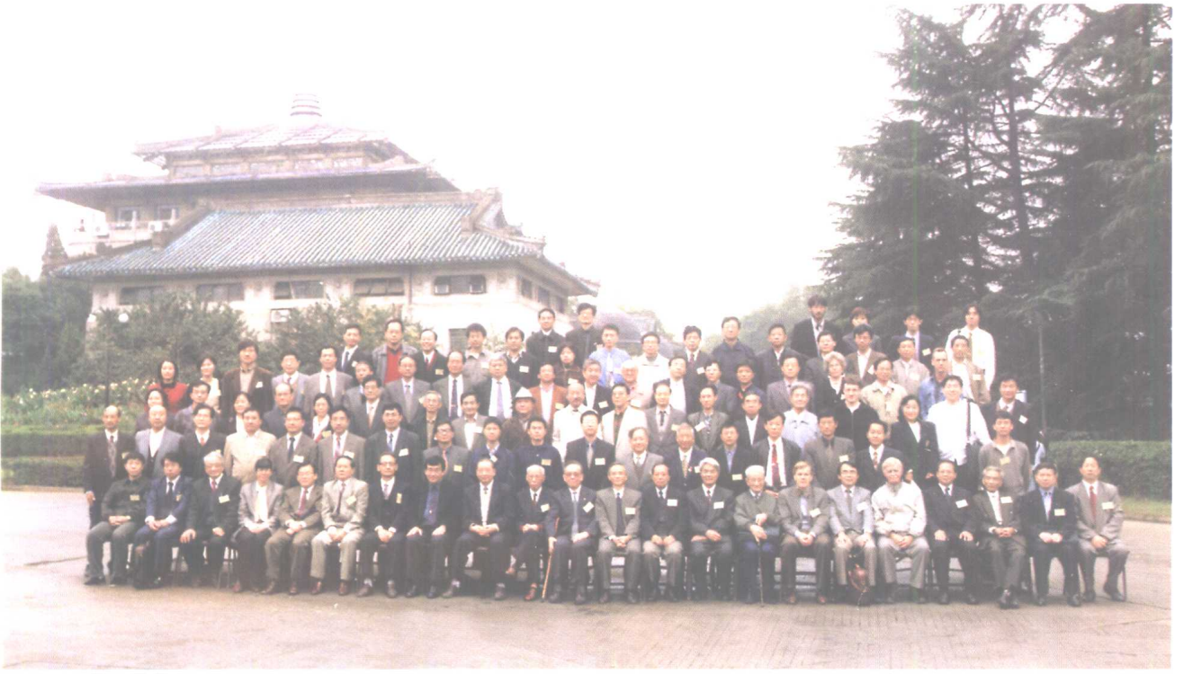
会议开幕式后，与会学者合影于武汉大学行政楼侧翼