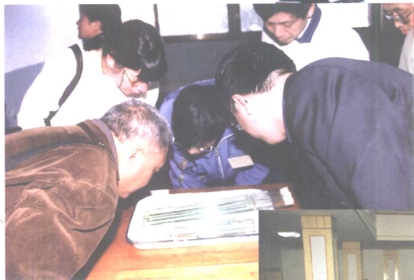
与会学者观赏郭店楚简实物