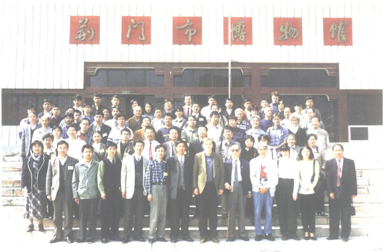
与会学者参观荆门市博物馆后合影